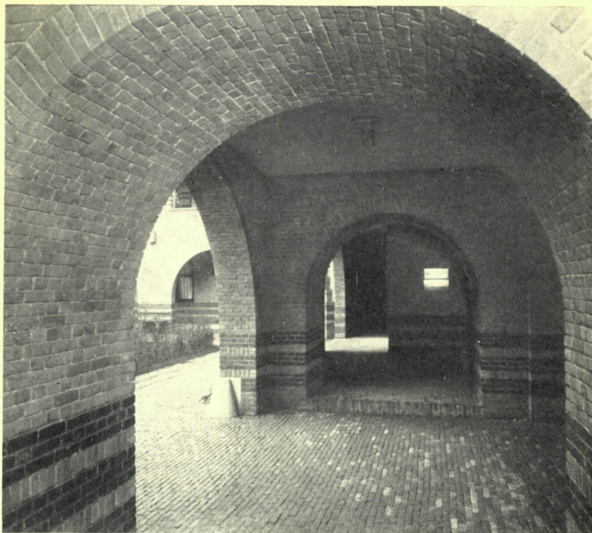
5. DE MATHENESSERHOF. NAAR EEN FOTO VAN F. H. VAN DIJK.