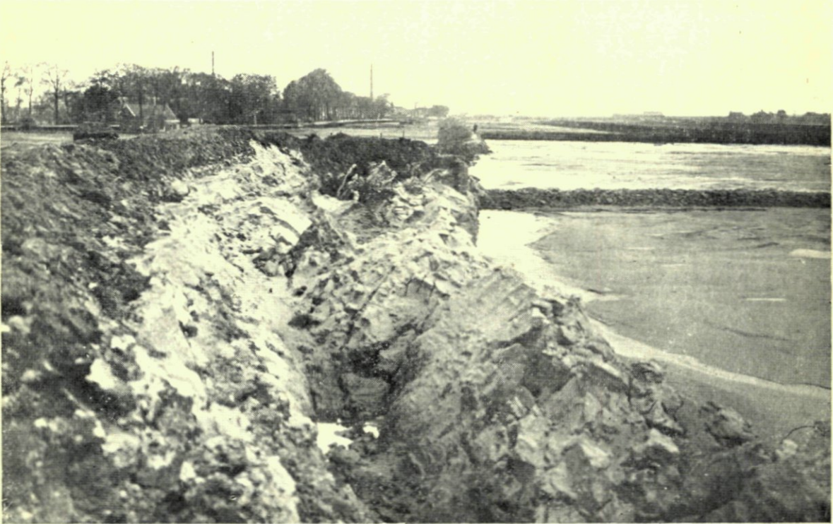
7. OPPERSINGEN VOOR HET KANAALPLAN BIJ DE DELFSHAVENSCHIE.