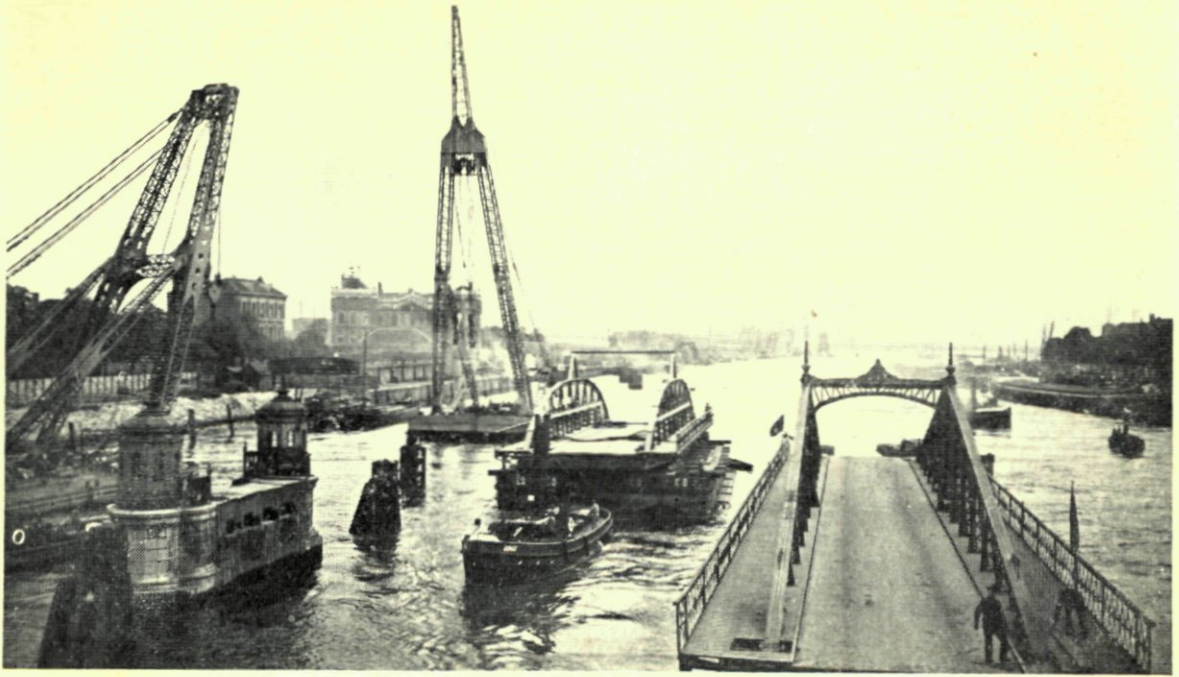
6. KONINGINNEBRUG. VERPLAATSEN VAN HET VASTE GEDEELTE.