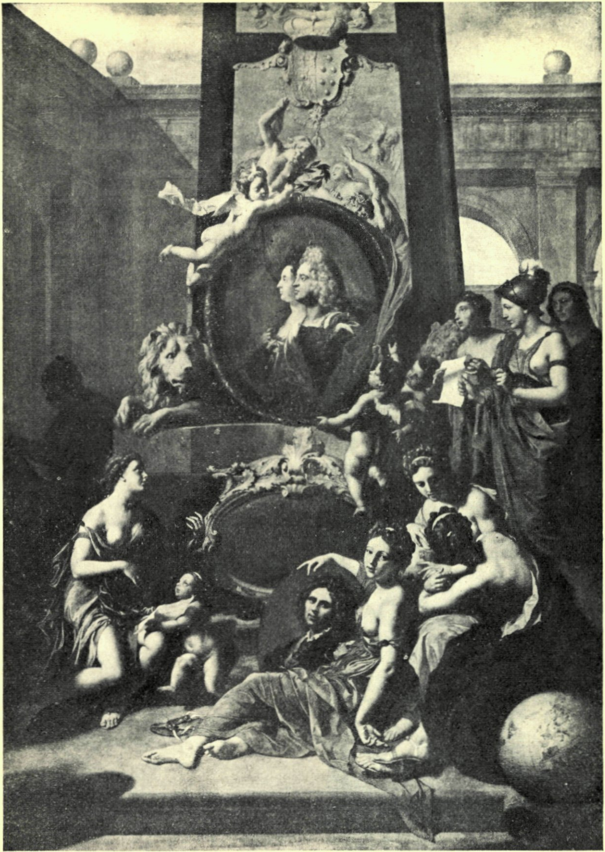
9. TITELSTUK VAN DE MYSTERIËN DER ROOMSCHE KERK. NAAR HET SCHILDERIJ VAN ADRIAEN VAN DER WERFF.