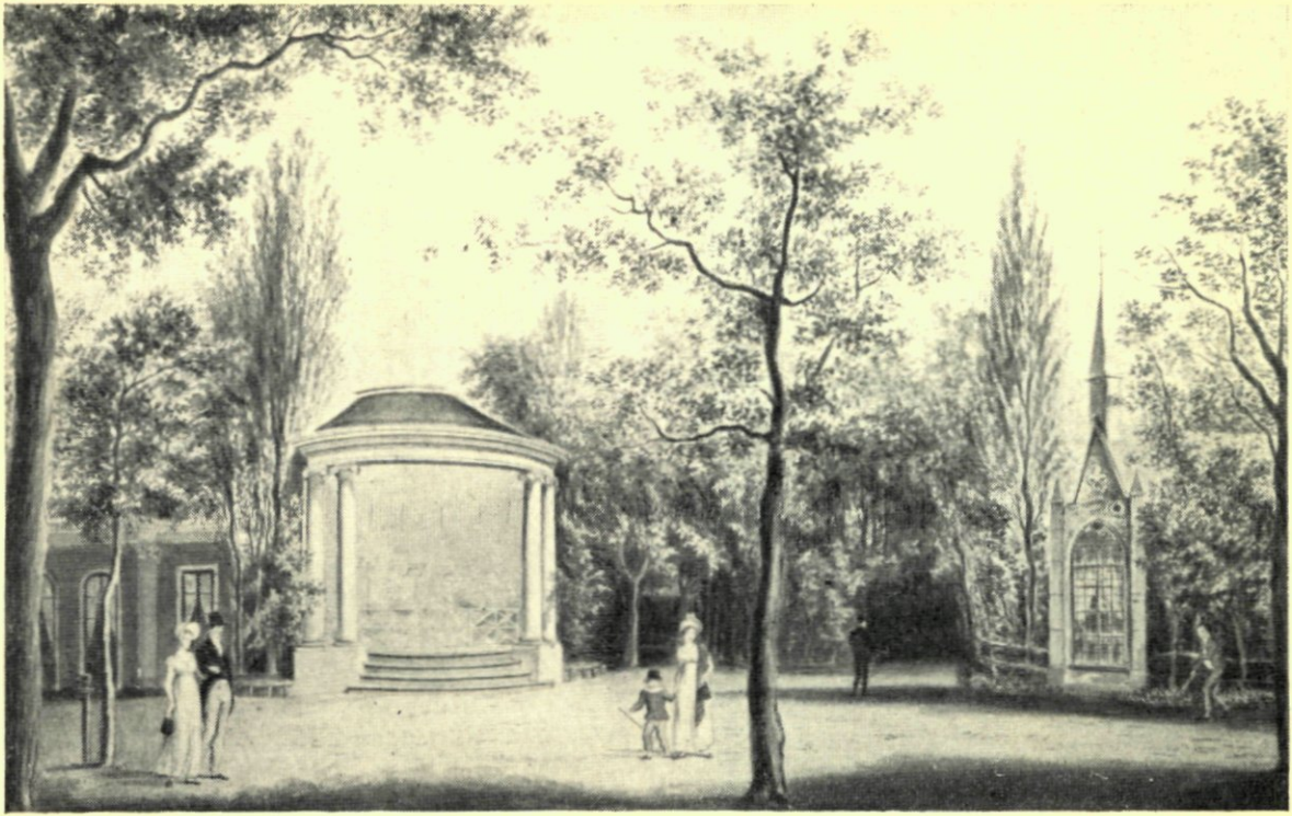
12. DE PLAATS GEZELLIGHEID OMSTREEKS 1810.