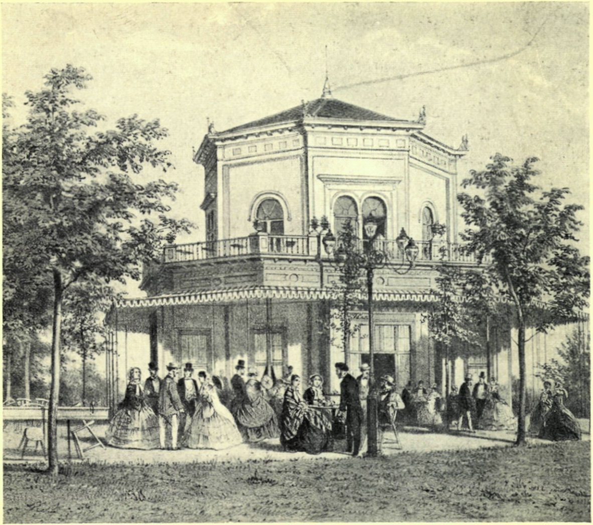
15. DE OFFICIEREN-SOCIETEIT IN HET PARK IN 1862.