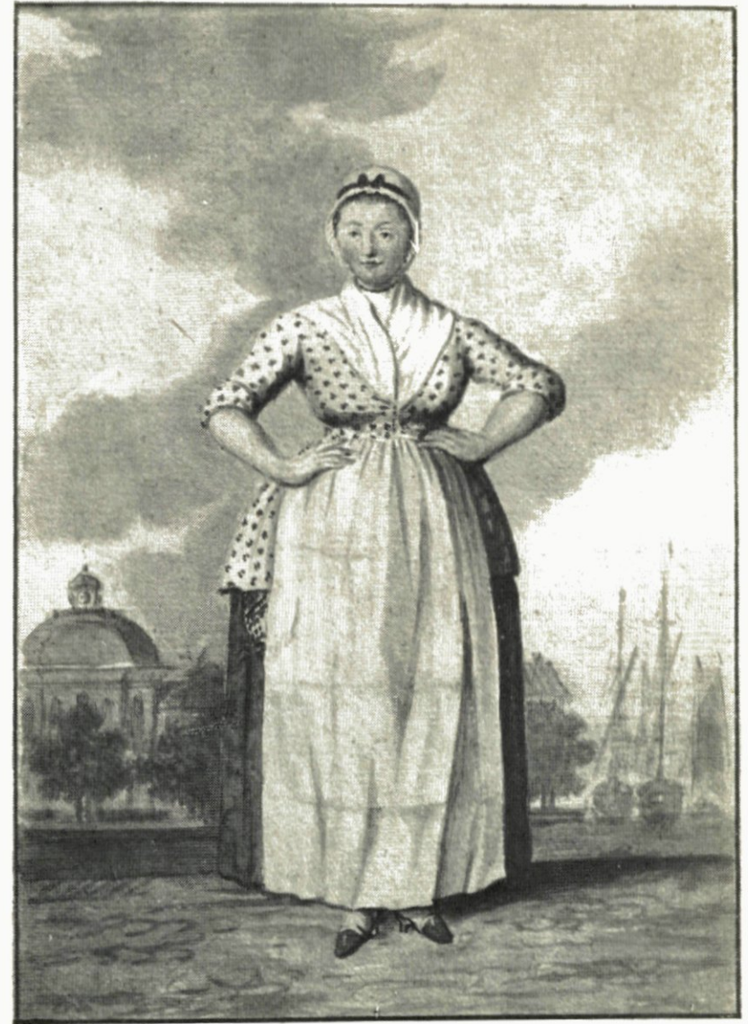
18. ROTTERDAMSCHER BÜRGERFRAU.