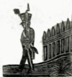
Als Schutter van den eersten bin, Doen 't voor de Koning wat ik kan.