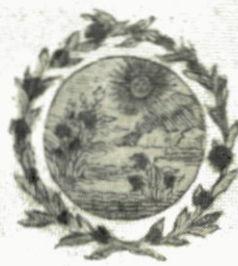
Oran' Zin vol Glorie, Schenkt voor ORANJE Victorie.