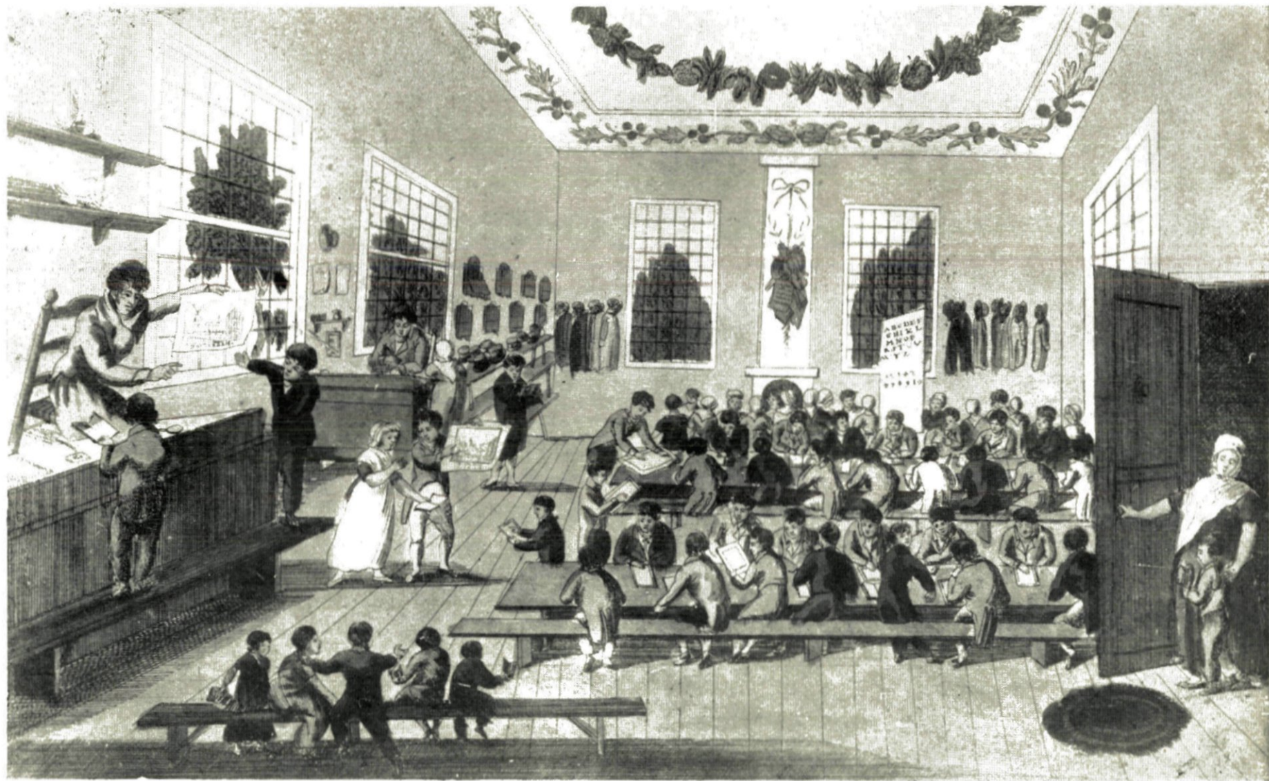
27. ROTTERDAMSCHER KINDERPRENT.