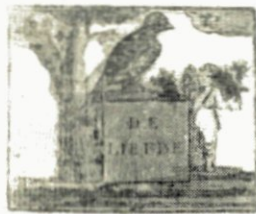
Wie wil voor dat het Duitje niet, Zien het geen Kwaadgrond.

Ziet kinderen, wilt deez' Prent beschouwen, Blijft op ORANJE steeds vertrouwen.