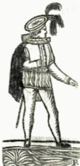
Was Nassau die Spaans Verhanden van den Troon, Was Willem van ORANJE , Die ALBA gaf zijn loon.