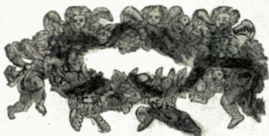
Wie draagt men de Kroon niet, Die alts' ons en heet niet.