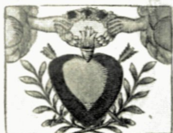
Mijn hart en hand, Bind Vriendschapsband.