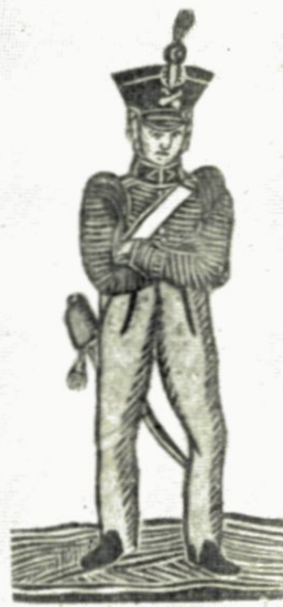
Gedienst, Veiligheid, Verdediging, Is ons eeuwigste plicht. Die dit ons eeuwig bezit, Is ons eeuwigste plicht.

Gedrukt bij J. B. ULRICH, Westewagenstraat E, 512 te ROTTERDAM.