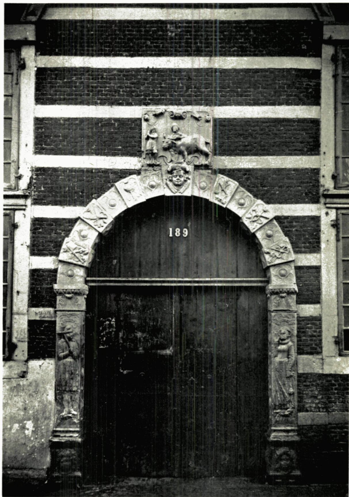
31. POORT VAN DE VOORMALIGE VLEESCHHAL.