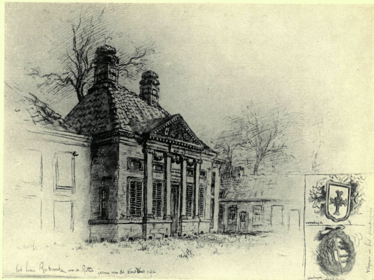
12. DE BUITENPLAATS RUBROEK. NAAR EEN GEKLEURDE PENTEEKENING DOOR A. J. GROENEWEGEN.