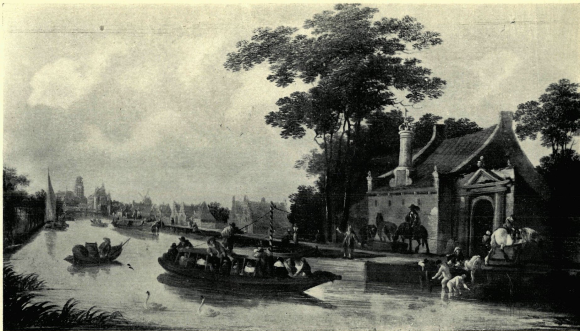
11. DE WESTZIJDE VAN DE SCHIEKADE MET DE POORT VAN HET LEPROOSHUIS VÓÓR 1669.