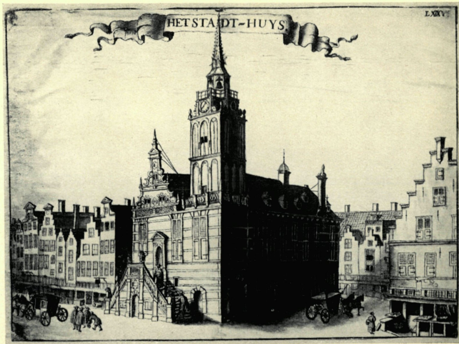
14. HET STADHUIS IN 1690. NAAR EEN TEEKENING DOOR J. DE VOU.