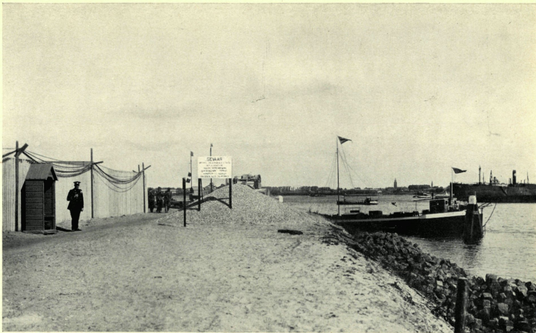
5. DE PETROLEUMHAVEN. NAAR EEN FOTO VAN GEMEENTEWERKEN.