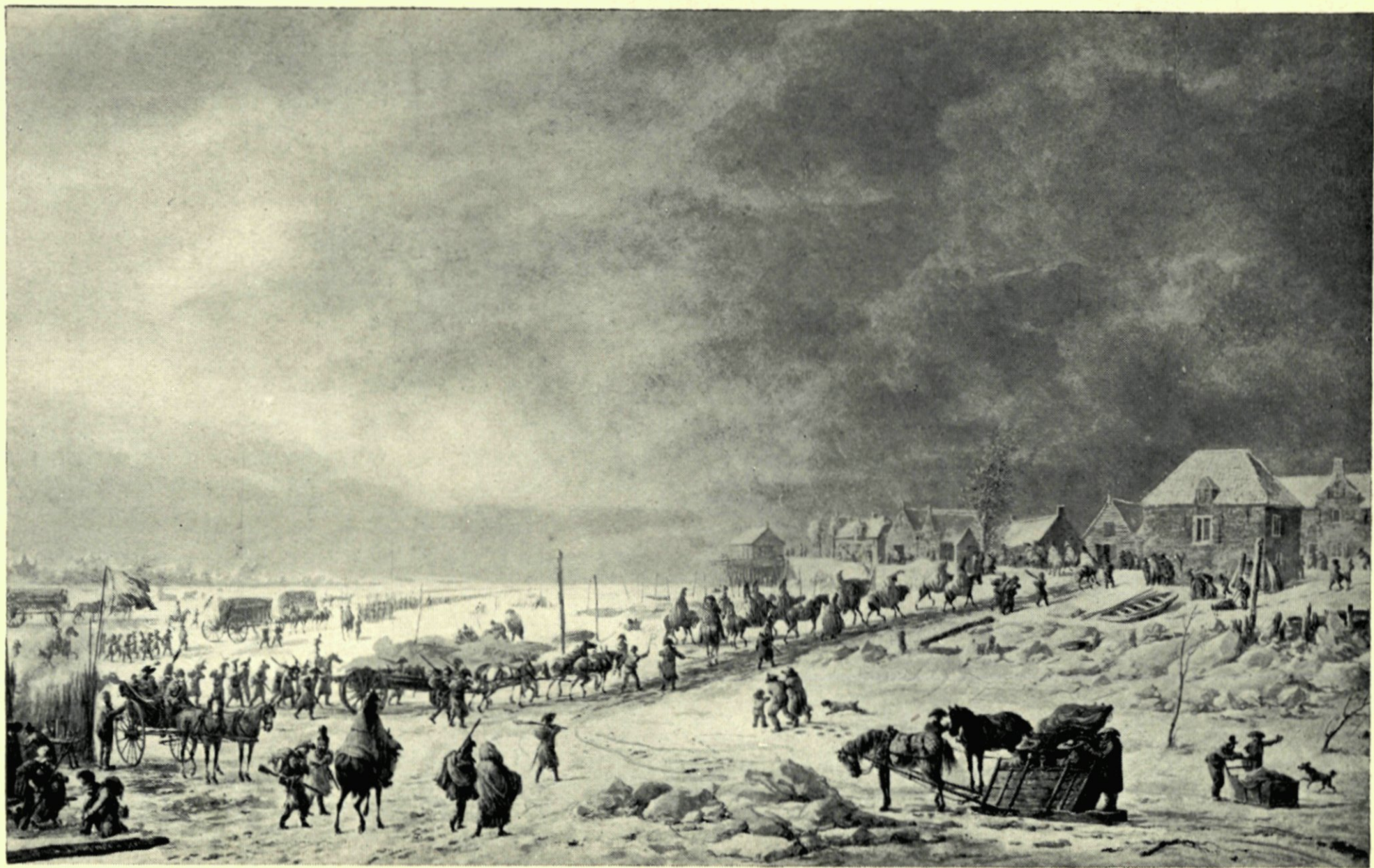
10. OVERTOCHT DER FRANSCHEN OVER DE MAAS BIJ HET KRALINGSCHVEER. JANUARI 1795. NAAR EEN TEEKENING DOOR DIRK LANGENDIJK.