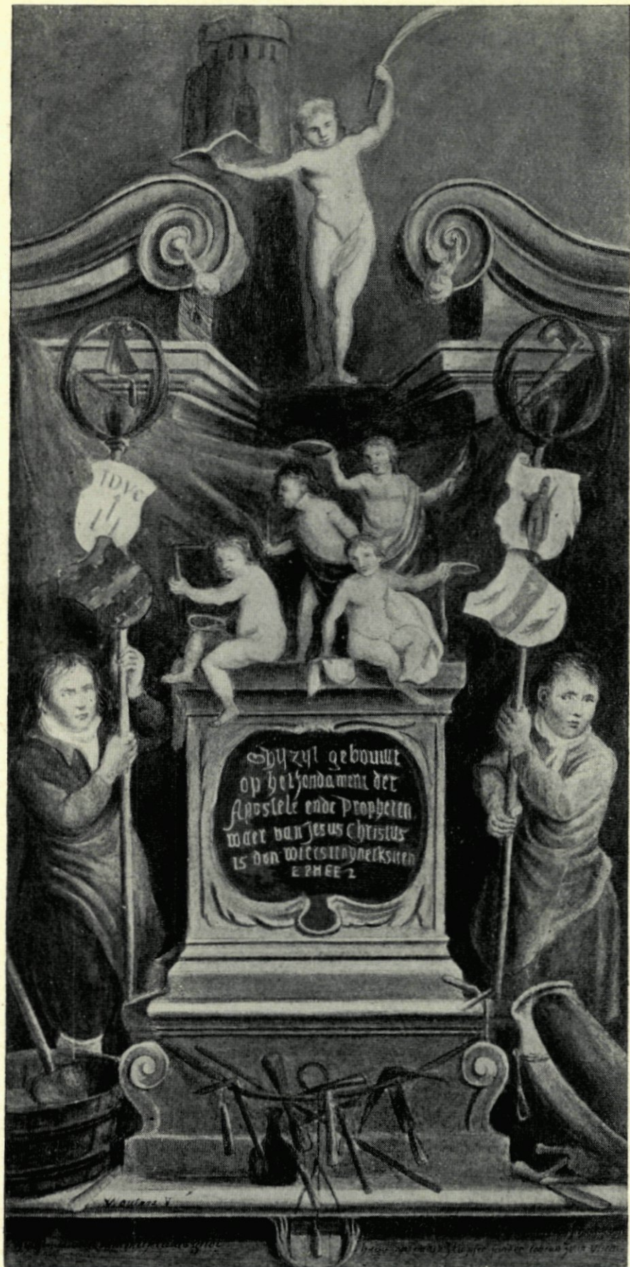
16. SCHILDERIJ IN DE KAPEL VAN HET METSELAARSGILDE IN DE GROOTE KERK.