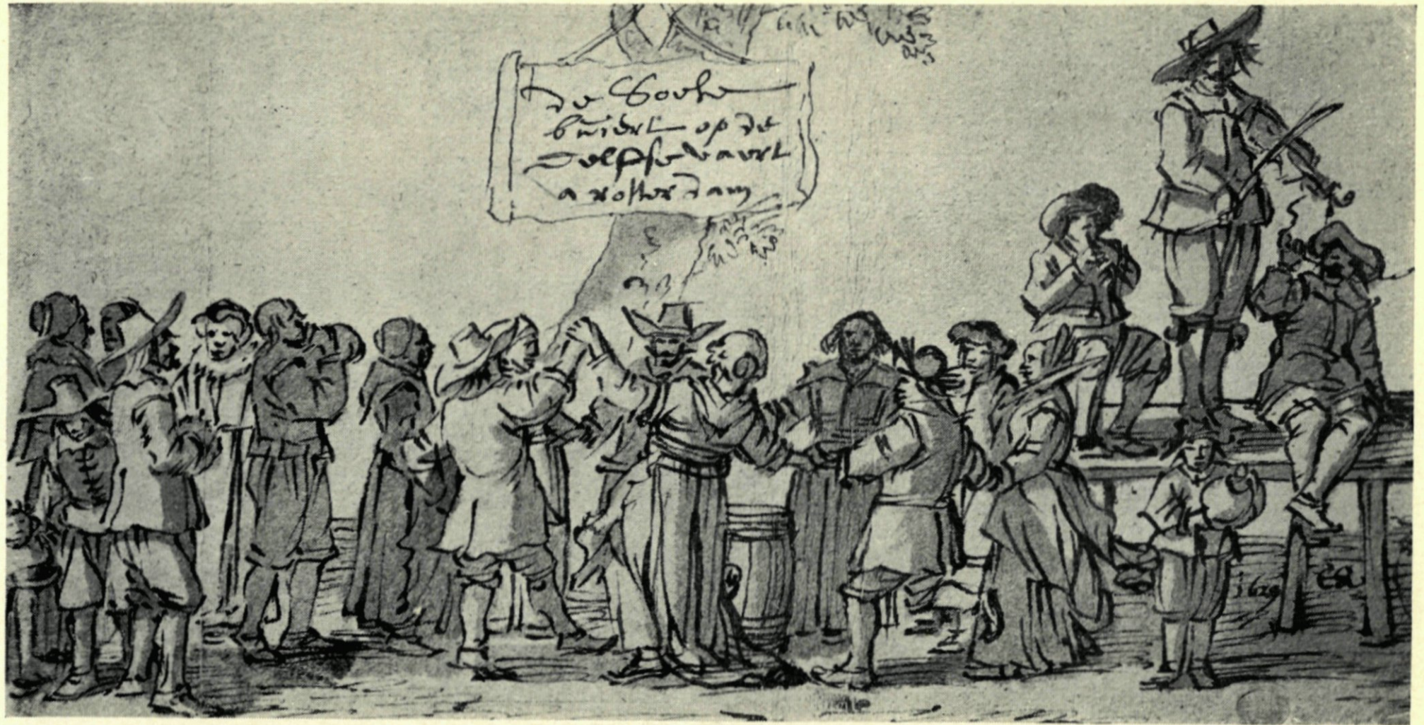
15. DE ZOETE BUURT OP DE DELFTSCHEVAART. NAAR EEN TEEKENING DOOR CORNELIS SAFTLEVEN IN HET MUSEUM BOYMANS.