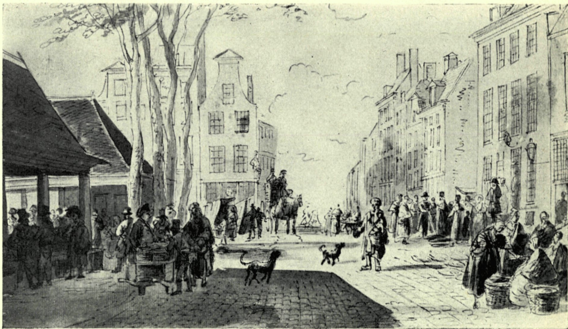
21. De Vismarkt gezien naar de Soetensteeg. Naar een schetstekening van G. Groenewegen.