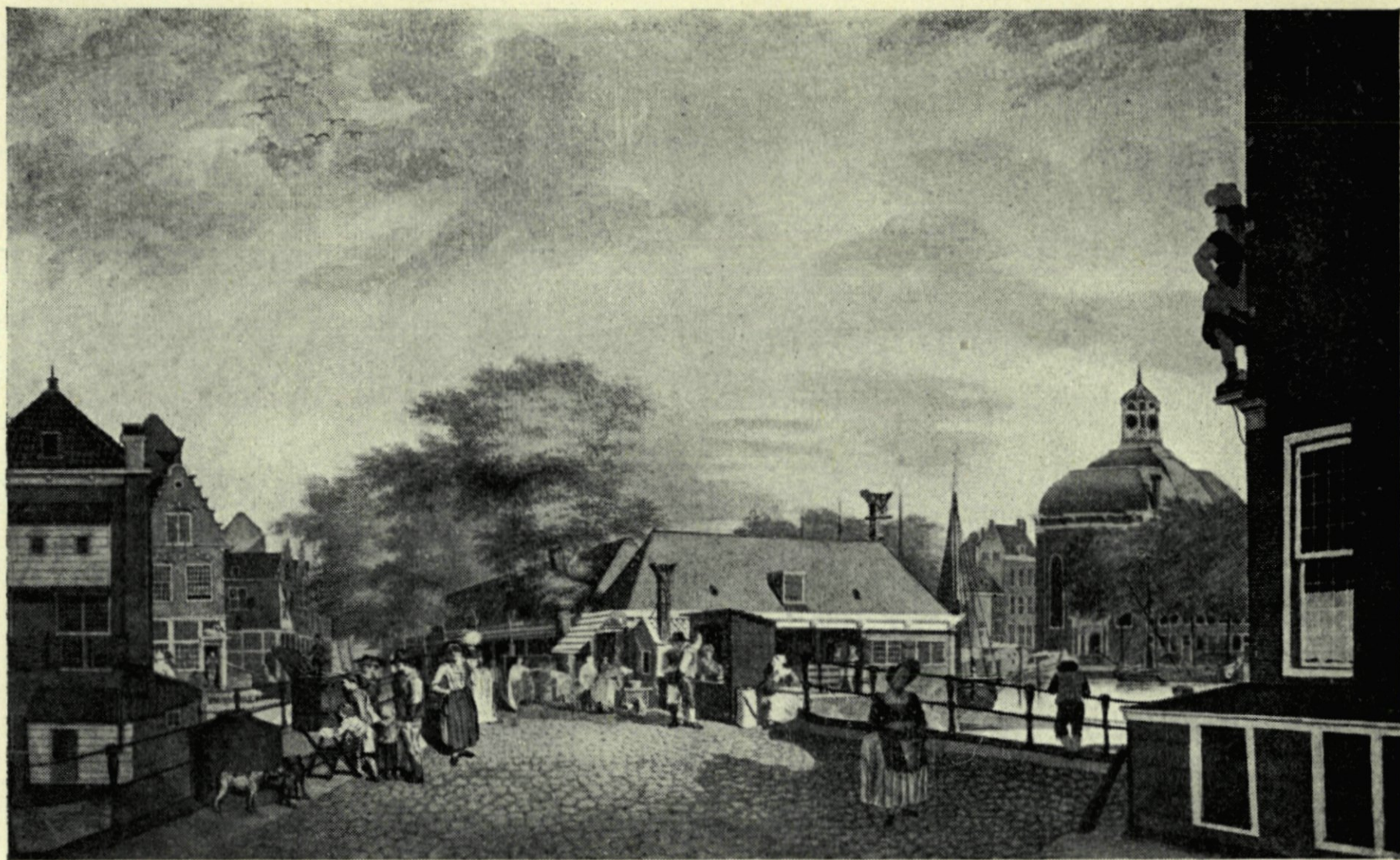
22. Gezicht uit de Soetensteeg langs Fruin's huis op de Vismarkt. Naar een tekening van Chr. Meyer.