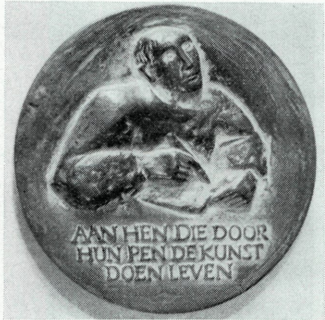
47. Penning van de Merwe, ontwerp M. Coppens-Frehe.