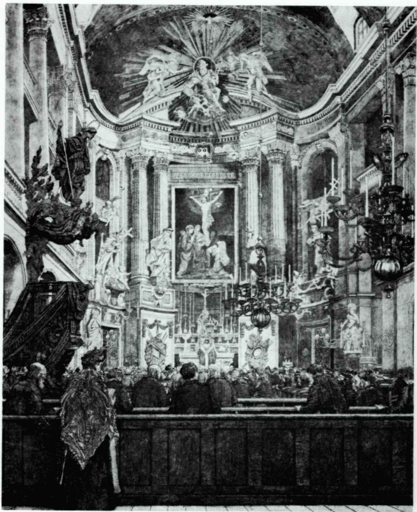
56. De St. Rosaliakerk aan de Leeuwenstraat, ca. 1928. Naar een ets van J. B. A. Lohmann.