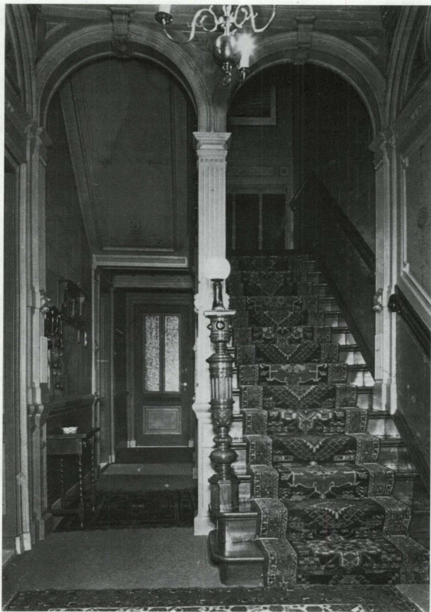
44. Trappenhuis van het gerestaureerde pand Westzeedijk 102, hoek Koningin Emmaplein.