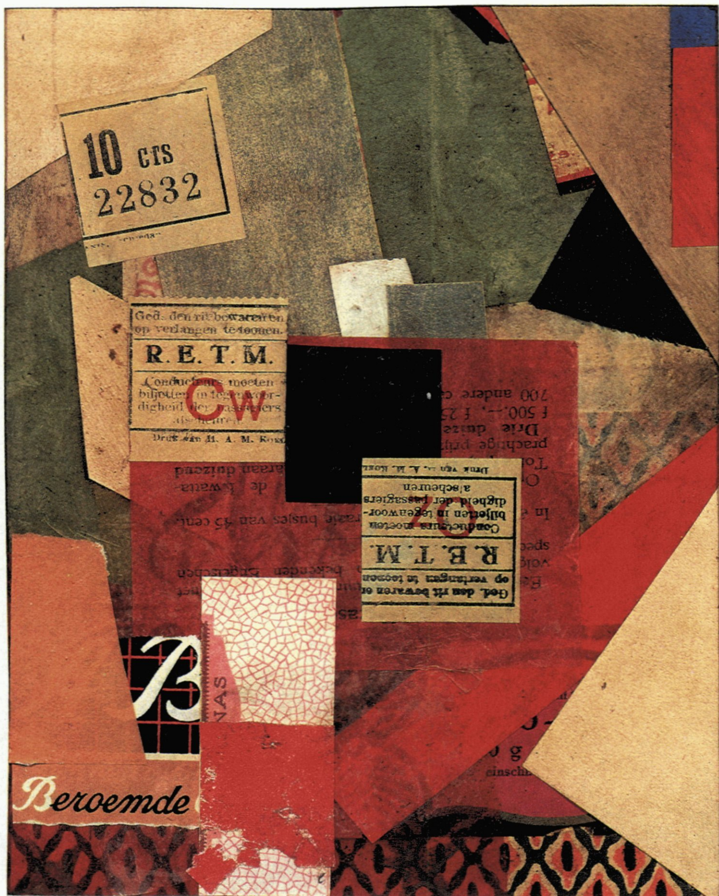
55. The Solomon R. Guggenheim Museum, New York. Kurt Schwitters: Merz 163, with Woman Sweating, 1920. Collage, 12" x 9".