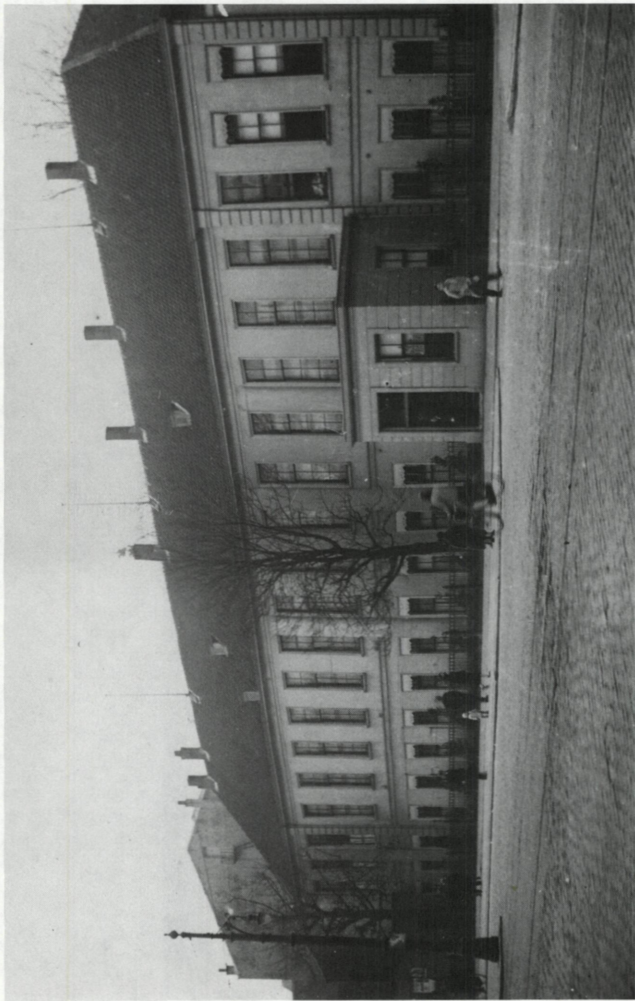
54. De Sociëteit Harmonie aan de Coolsingel, ca. 1930.