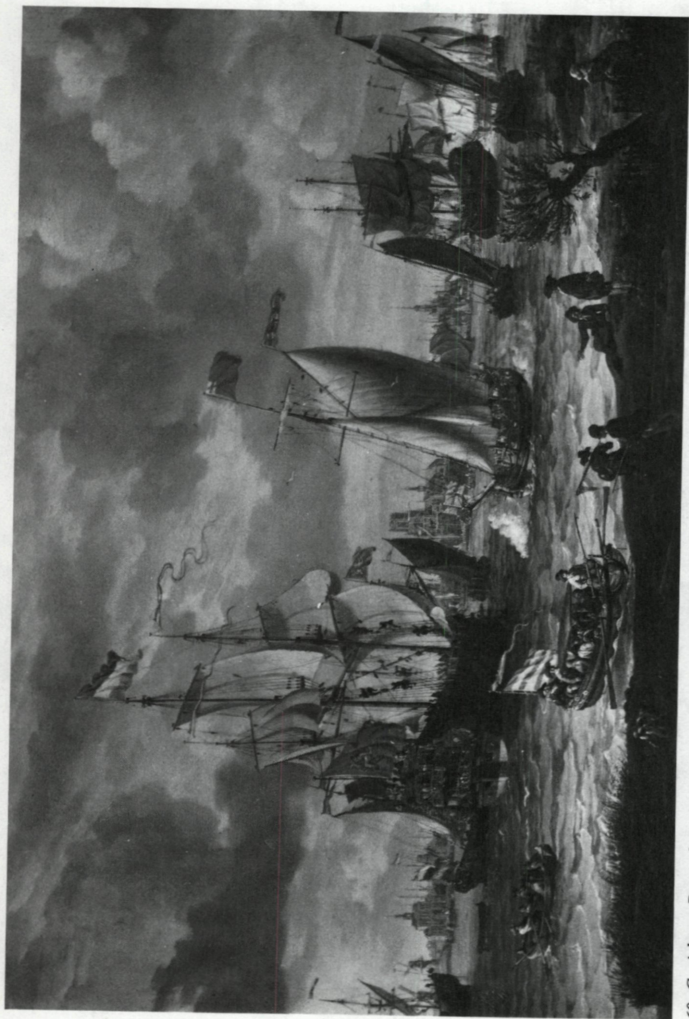
60. Gezicht op Rotterdam, ca. 1690; naar een schilderij van Abraham Storck.