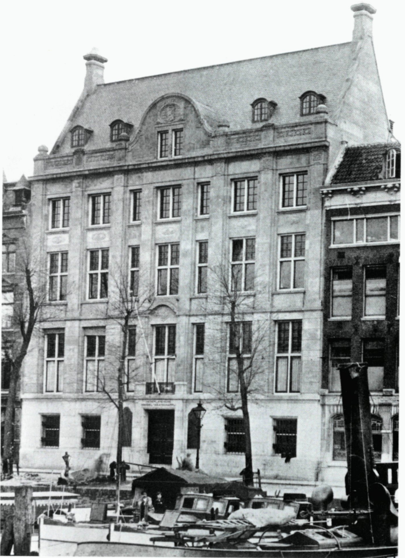
54. De Nederlandsche Handel-Maatschappij aan de Zuidblaak.