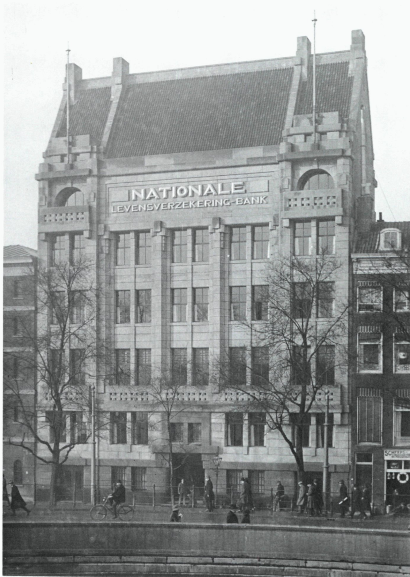
53. De Nationale Levensverzekering-Bank aan de Boompjes, 1925.