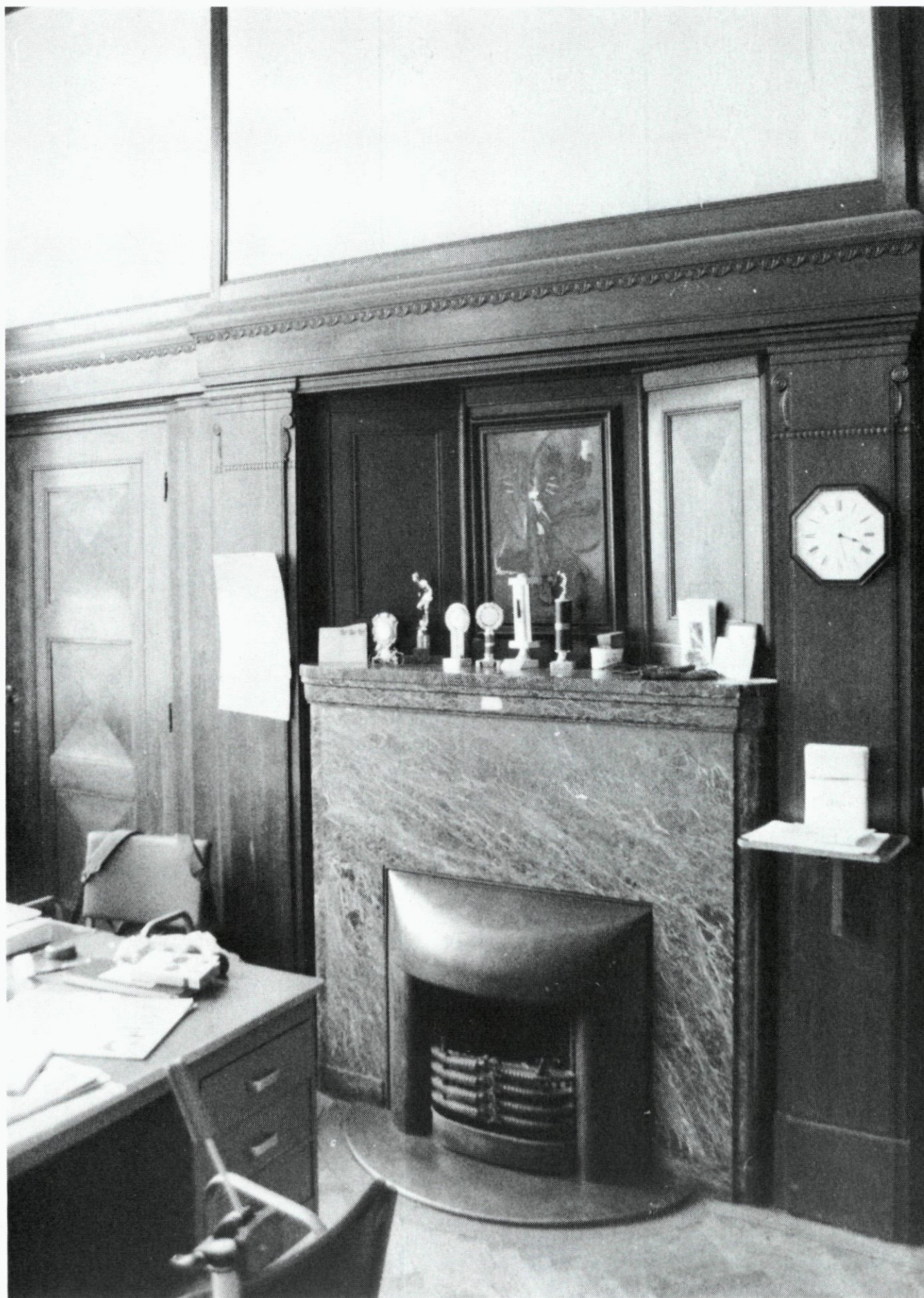
55. Kamer op de begane grond van het Hudighuis.