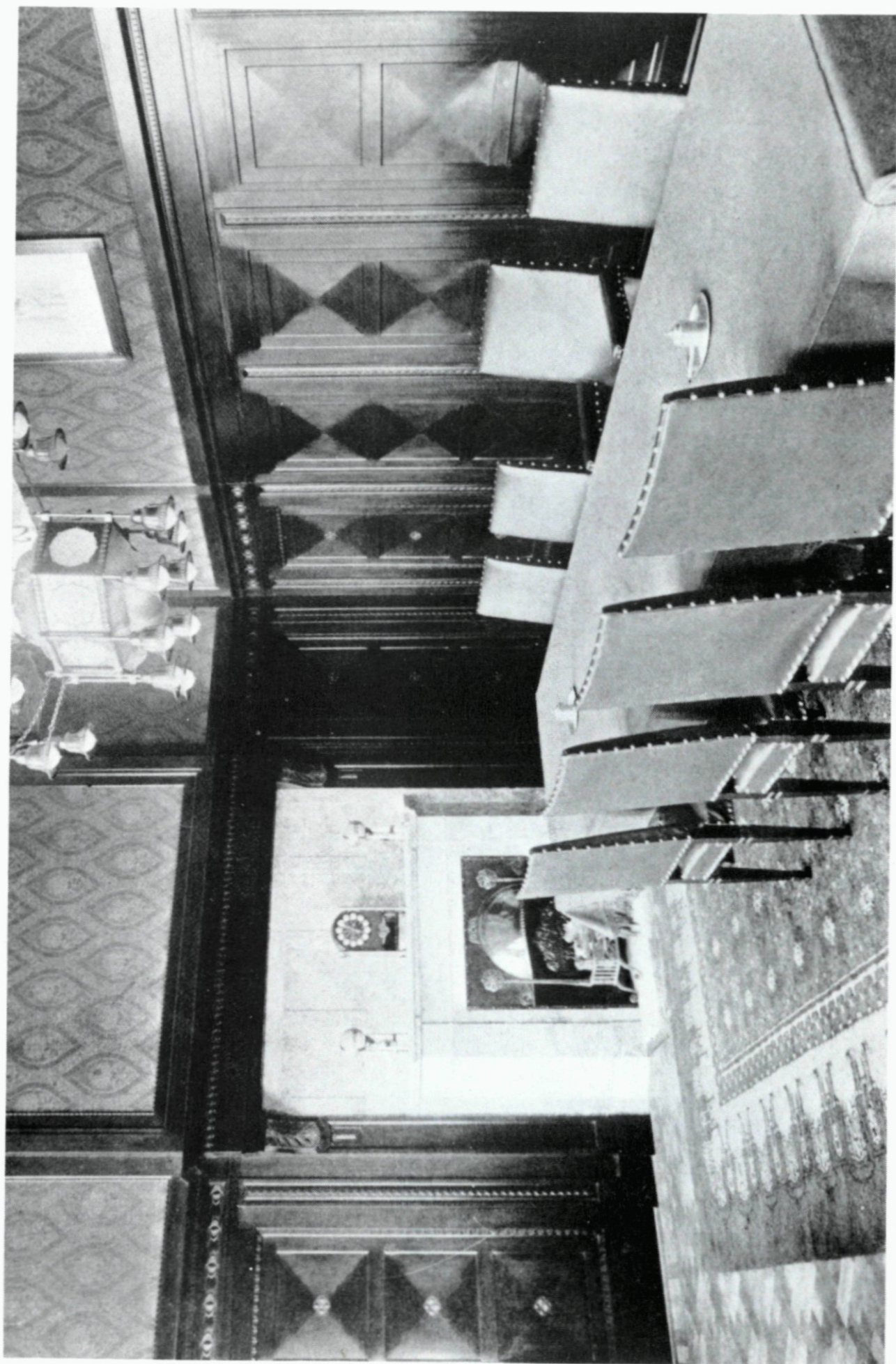
56. Vergaderzaal in het gebouw van de Nederlandsche Handel-Maatschappij.