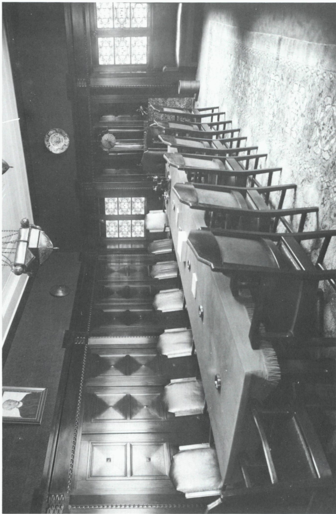
57. Vergaderzaal in het gebouw van de Nationale Levensverzekering-Bank, 1925.