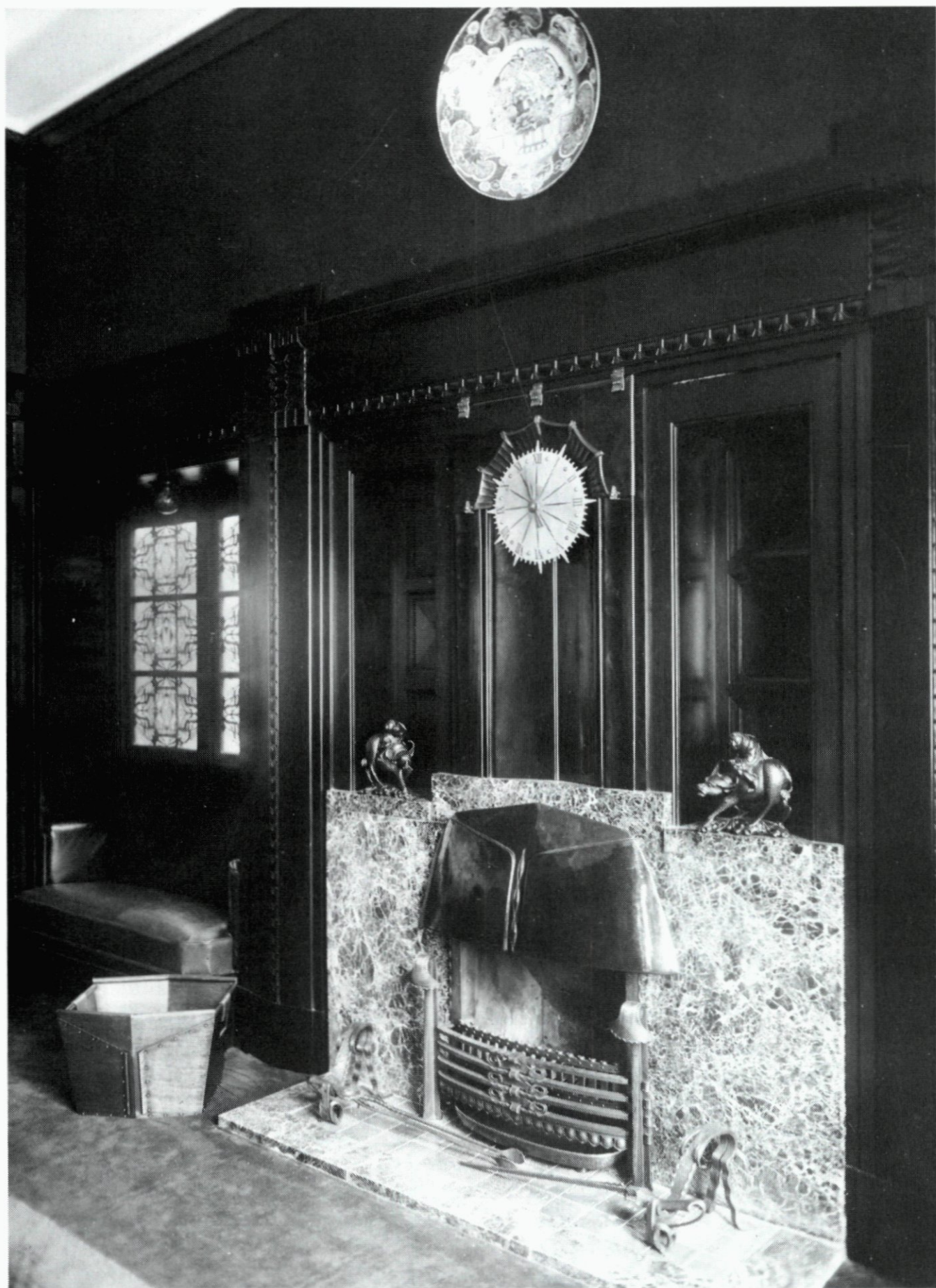
58. Schouw in de vergaderzaal (zie afb. 57) van de Nationale Levensverzekering-Bank, 1925.