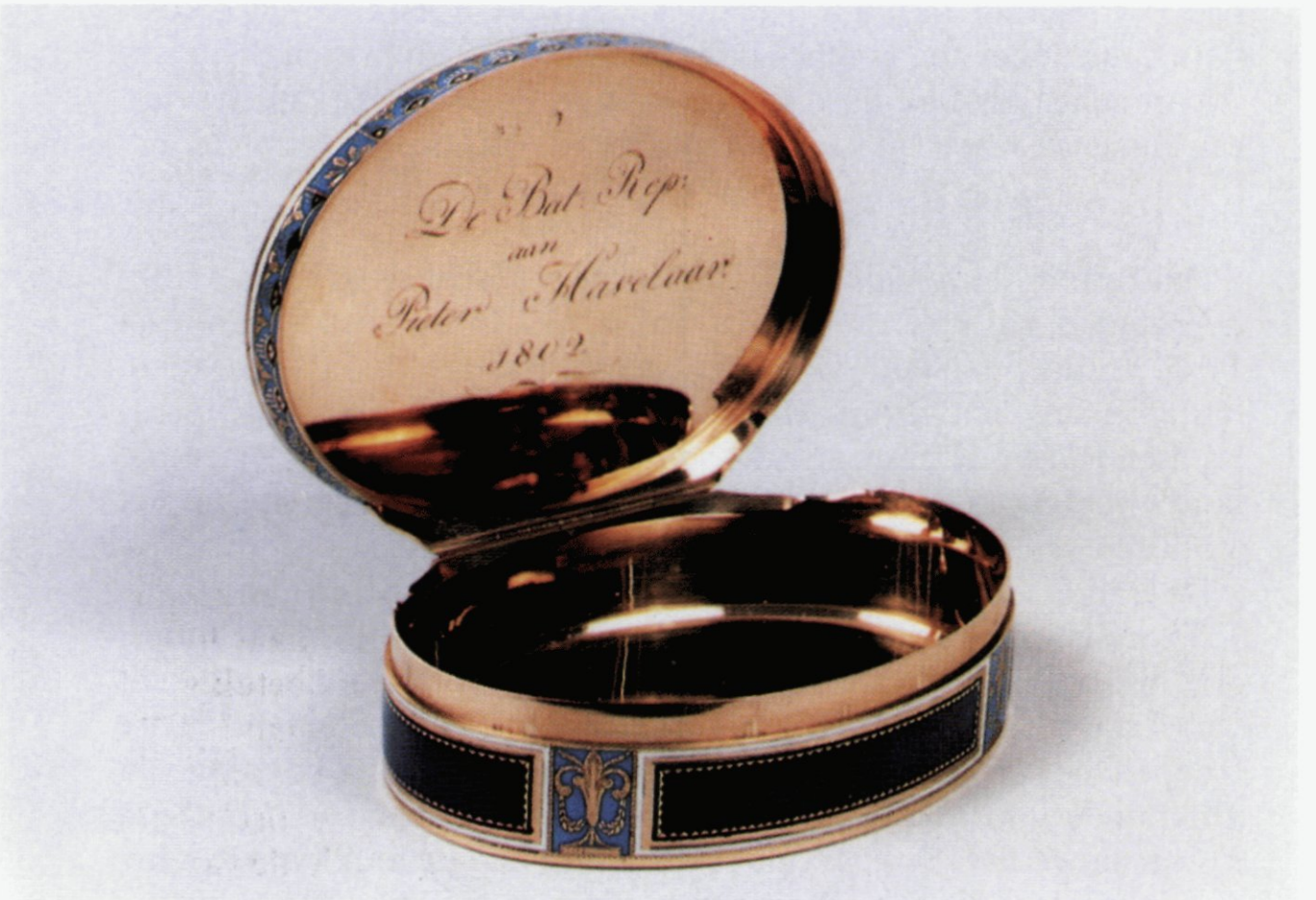
70. De aan Pieter Havelaar geschonken gouden snuifdoos; boven: de gesloten doos, onder: geopende doos met aan de binnenzijde gegraveerd deksel. Historisch Museum Rotterdam.