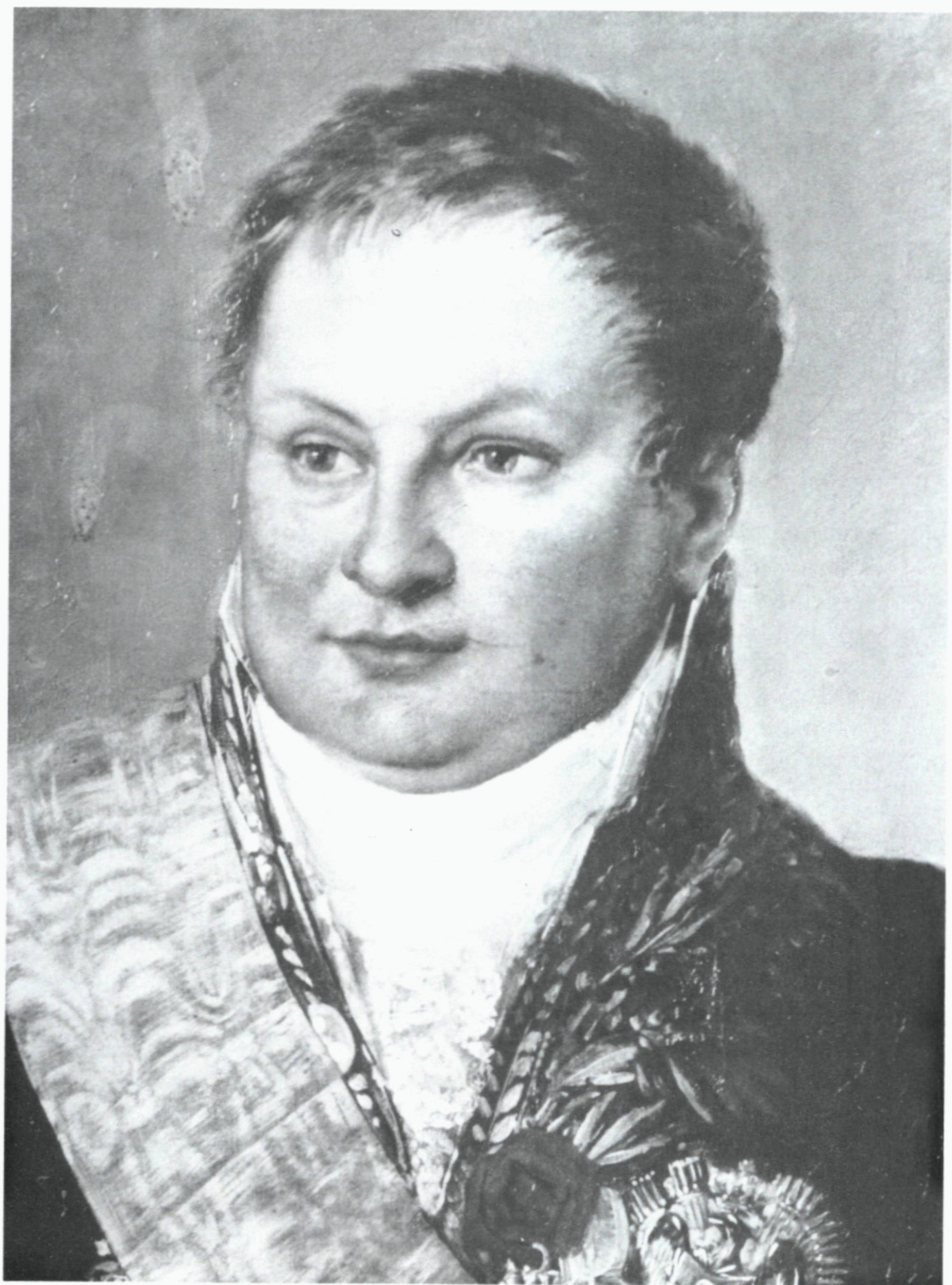
73. Portret van I.J.A. Gogel (1765-1821). Detail van schilderij van Van Bree.