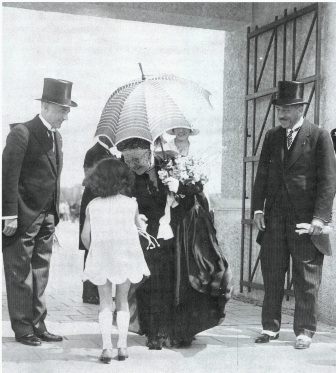
88. Koningin-moeder Emma ontvangt bloemen bij aankomst op de Nenijs te Rotterdam, 17 juli 1928.