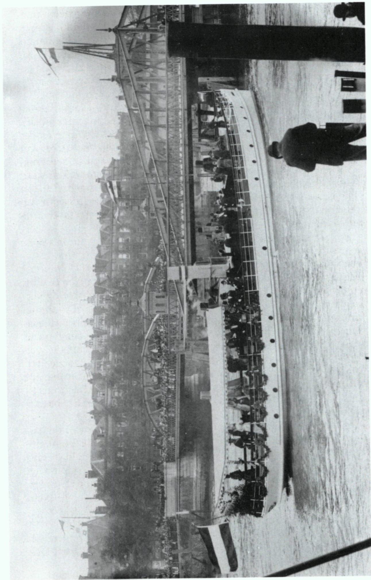
87. Koningin Wilhelmina en koningin-moeder Emma maken aan boord van de tender 'Columbus' een tocht over de rivier en door de havens, 25 september 1899.