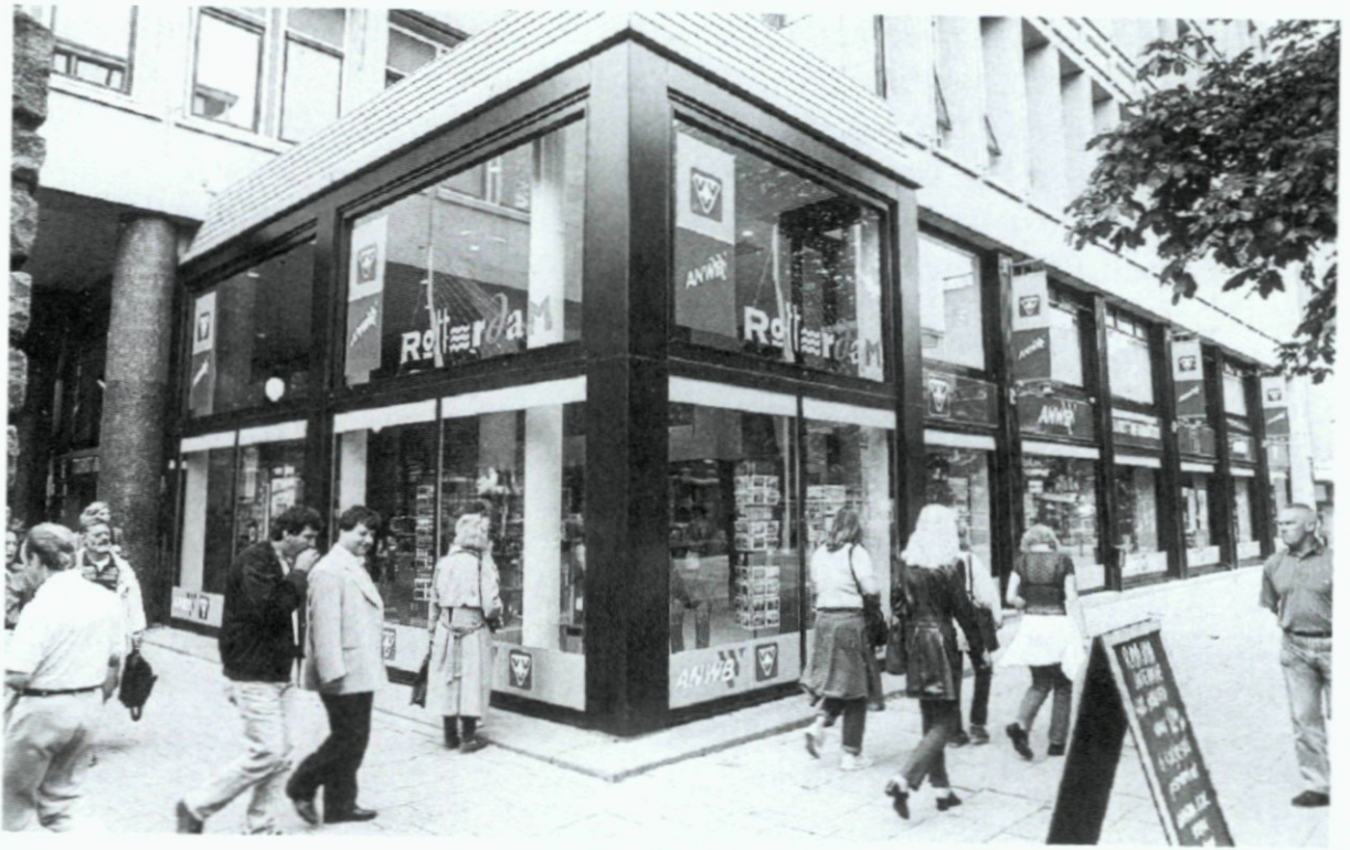
10. Het gezamenlijke onderkomen van de Vereniging voor Vreemdelingenverkeer (VVV) en de Nederlandse Toeristenbond ANWB op de Coolingsingel; 2 juni.