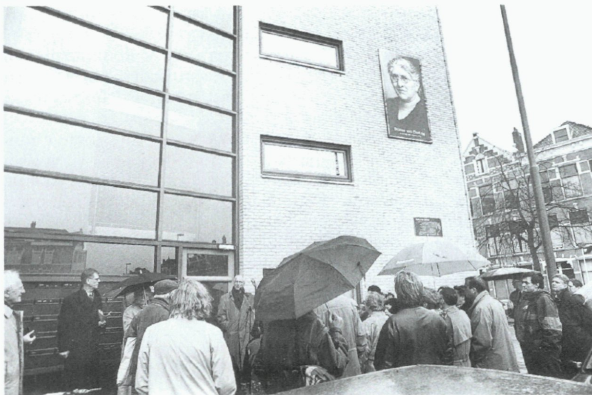
20. Ter gelegenheid van de opening van het Branco van Dantzigpark worden een bronzen herinneringsplaquette en een schilderij onthuld; 21 oktober.

(Prinsenland) de eerste paal voor een pand met 26 klaslokalen die door de Dienst Stedelijk Onderwijs worden gehuurd voor basisschool De Stelberg en later verbouwd kunnen worden tot kantoorruimten (arch. Van 't Hof Architecten, Driebergen).