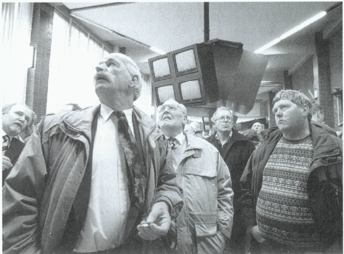
23. Op de Rotterdamse schippersbeurs worden voor de laatste keer vrachten aangeboden; 27 november.