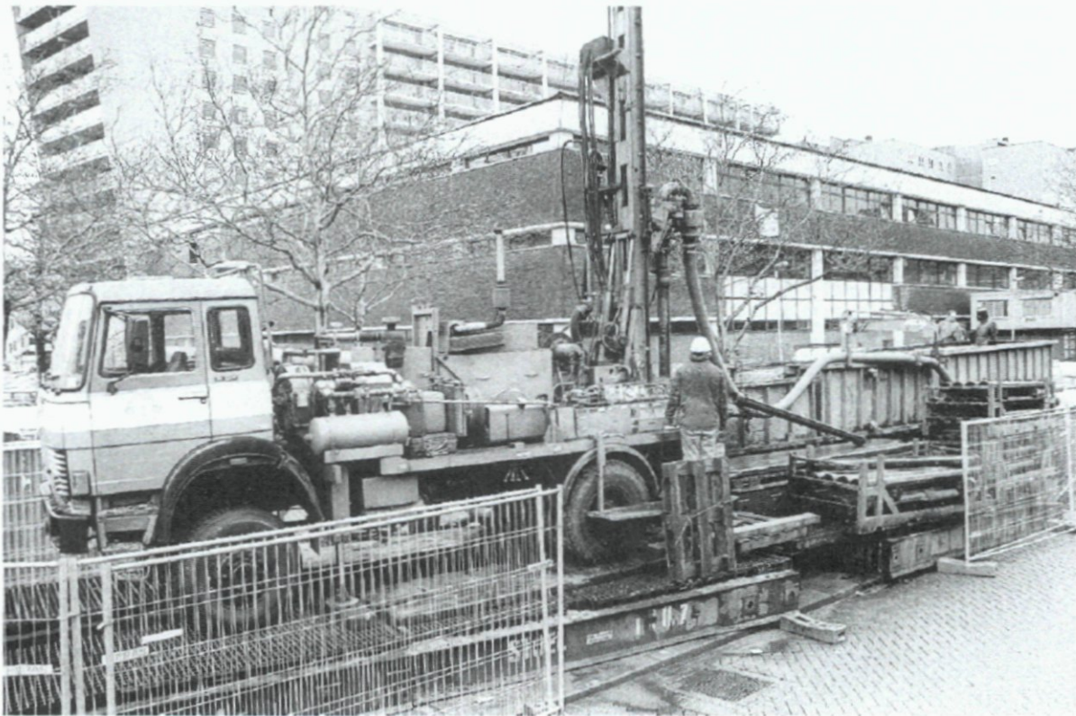
4. Aan de Hofdijk worden boorwerkzaamheden verricht voor de ondergrondse opslagplaats ten behoeve van de klimaatbeheersing van het nieuwe gebouw van het Gemeentearchief; 19 januari.