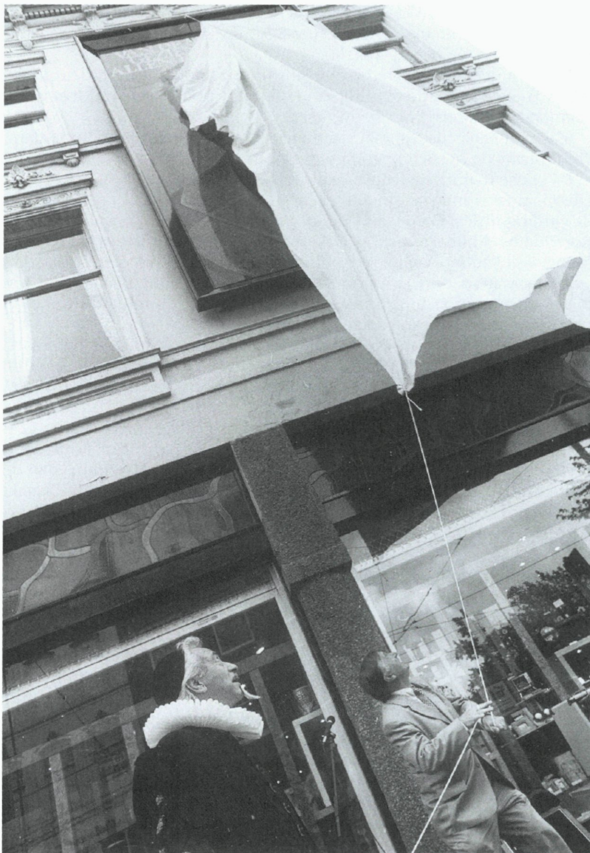
12. Wethouder J. Kombrink onthult op de hoek van de Van Oldenbarneveltstraat/Mauritsweg het portret van de schrijver Multatuli; 13 juni.