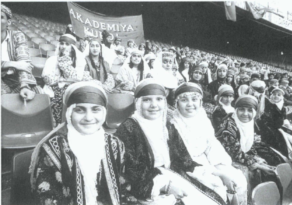
16. Cultureel festival van Koerden in het Feyenoord Stadion; 12 september.

12. Open Monumentendag, die ter gelegenheid van het 100-jarig bestaan van Het Witte Huis aan de Geldersekafe als thema 'witte huizen' heeft meegekregen. De eigenaren van twee panden aan de Waterloostraat ontvangen een onderscheiding van het Historisch Genootschap Rotterdamum.