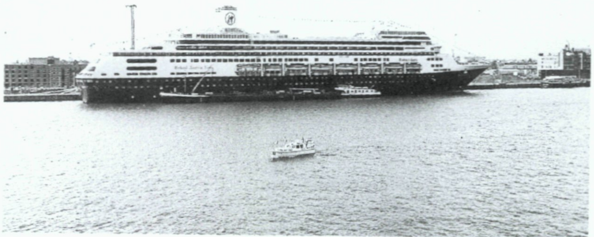
11. Het cruiseschip 'Rotterdam' brengt ter gelegenheid van het 125-jarig bestaan van de Holland-Amerika Lijn een bezoek aan Rotterdam; 10 juni.