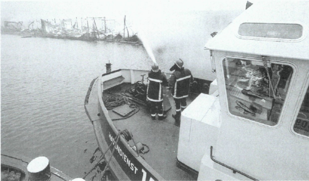
5. Brand op het bedrijventerrein Kleinpolder aan de Abraham van Stolkweg; 29 januari.