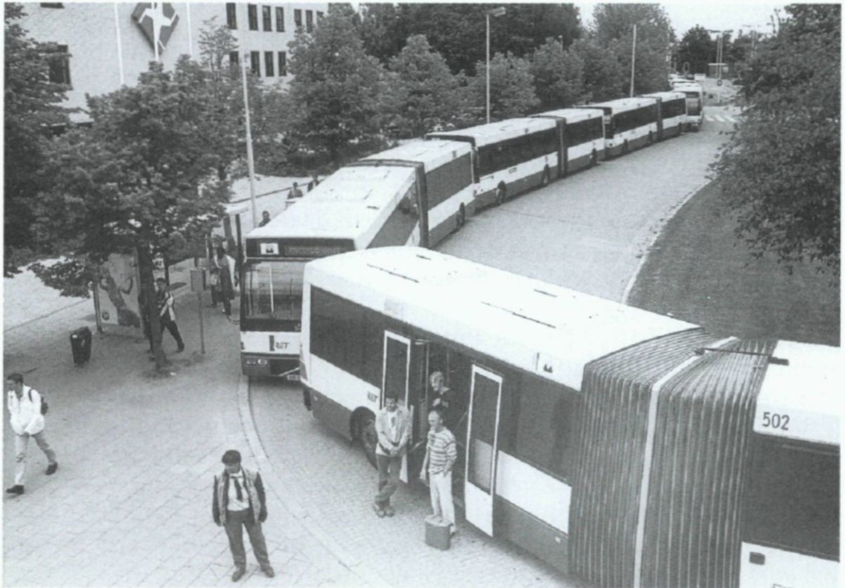
9. Tijdens de werkzaamheden aan het afgraven van de aarden metrobaan bij Pendrecht worden tussen de metrostations Slinge en Poortugaal pendelbussen ingezet; 22 mei.

22. Medegedeeld wordt dat de Stichting Thuiszorg Rotterdam aan de Zomerhofstraat (Agniesebuurt) is gestart met een eigen vakopleiding: de Thuiszorg Vakschool Rotterdam.