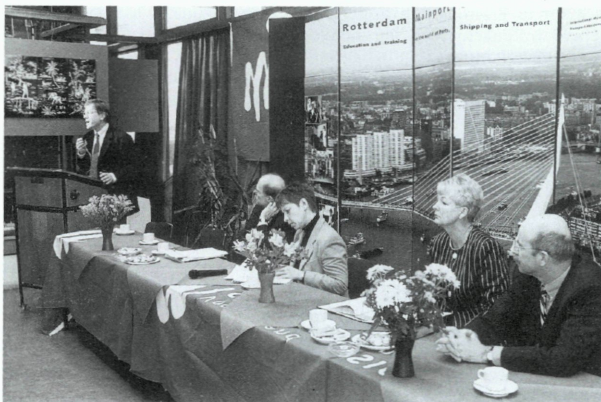
3. De staatssecretarissen mevrouw A. van Dok-van Weele en mr. J. Kohnstamm (l) brengen een bezoek aan het Scheepvaart- en Transport College aan de Soerweg; 15 januari.

12. Bekendgemaakt wordt dat de Stichting Rotterdamse Beiaard Commissie (opgericht in 1947) wordt opgeheven. Het organiseren van concerten kan voortaan door de musici zelf worden geregeld omdat bedrijfsvoering deel uitmaakt van de opleiding tot beiaardier.