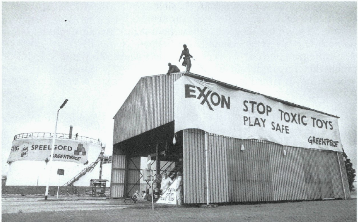
14. Bezetting van het bedrijfsterrein van Exxon Chemical Holland in het Botlekgebied door de milieuorganisatie Greenpeace; 30 juni.