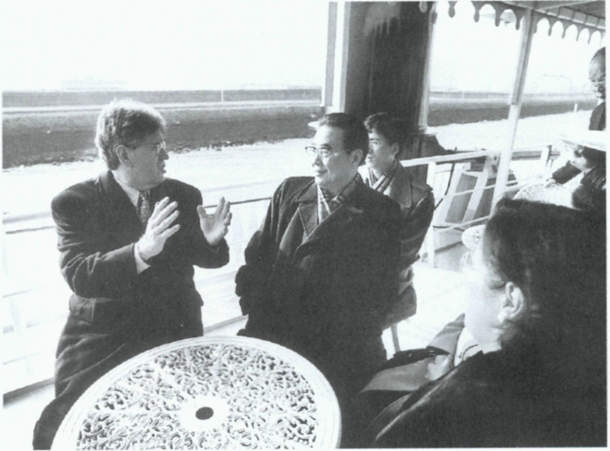
6. De premier van China, Li Peng, brengt een bezoek aan Rotterdam; 15 februari.

17. Met drie drijvende bokken wordt een 730 ton zware containerkraan vervoerd van kraanbouwer Nelcon BV aan de Maashaven naar het overslagbedrijf European Combined Terminals BV aan de Prins Willem-Alexanderhaven.