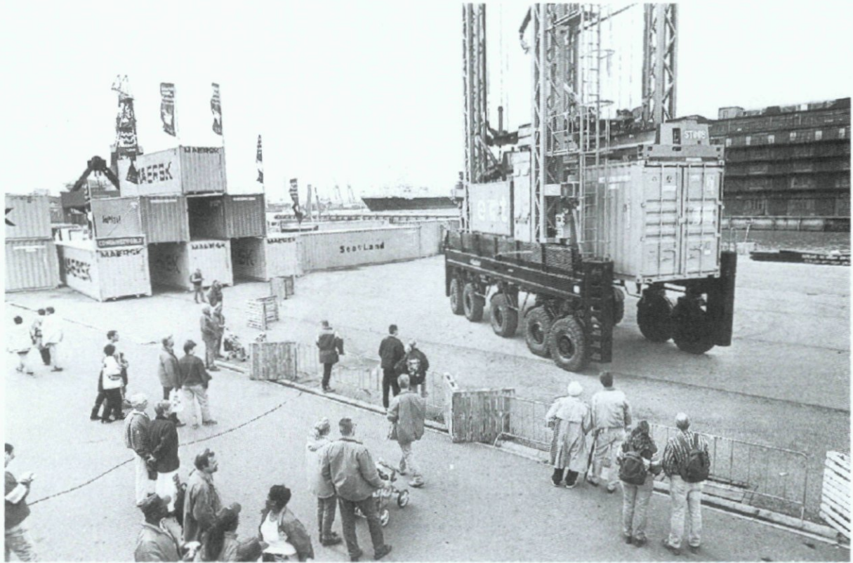
15. Het Wereldhaven Festival Rotterdam op de Müllerpier; 5 september.

6. Op de Coolsingel vindt de start en finish plaats van de eerste aflevering van 'Rotterdam on Wheels', een manifestatie met onder meer het Nederlands kampioenschap wheelermarathon, (gewonnen door de Zwitser Heinz Frei) en een marathon voor skeelers en in-line-skaters.