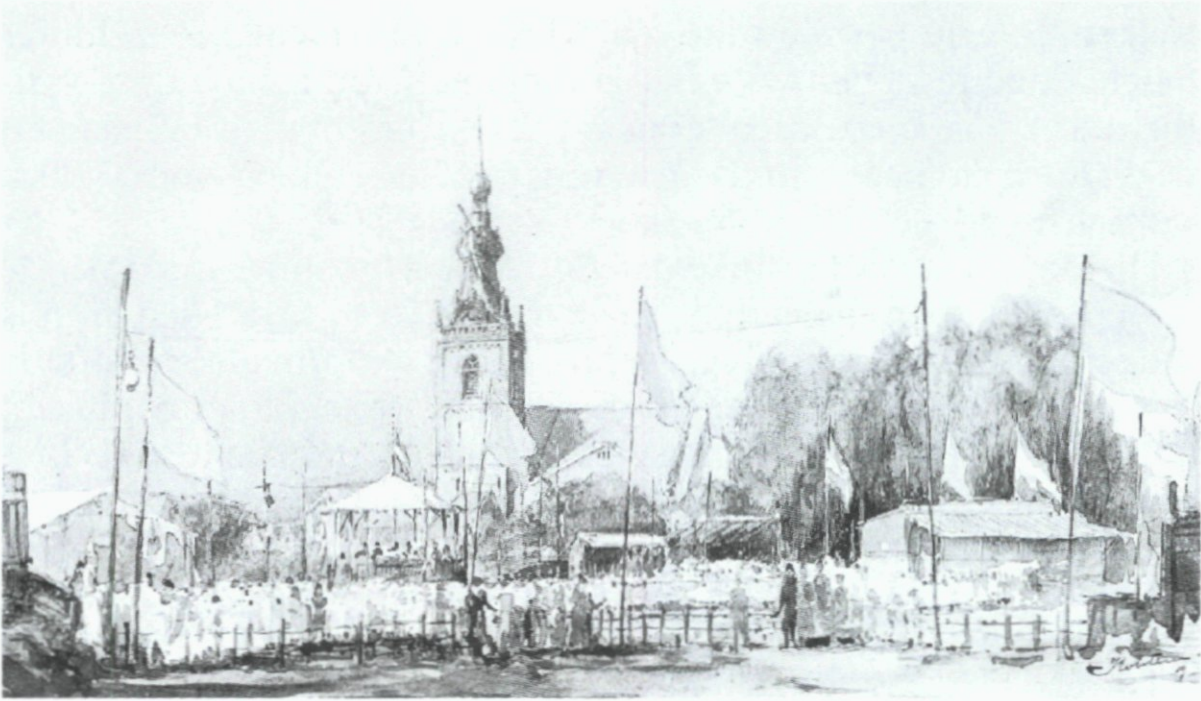
55. Oranjefeest in Overschie, 1919. Waterverftekening door Nic. M. Kolsteren. Collectie GAR.

De groep die niet (meer) bediend werd door het oude Volksvermaken zorgde dus na de eeuwwisseling voor haar eigen - veredeld? - vermaak. De vraag is hoe het bestuur daar tegenover stond. Heeft het een actieve rol gespeeld bij de totstandkoming van deze zusterverenigingen? Vermoedelijk niet, want daarvoor was de sociale kloof te groot. Wel is het waarschijnlijk dat zij een voorbeeldfunctie heeft vervuld, zeker gezien de taak die de vereniging sinds 1903 ten deel viel: om derden te stimuleren tot het organiseren van koninginnefeesten. Eenzelfde soort voorbeeldfunctie vervulde zij al sinds het laatste decennium van de negentiende eeuw bij de oprichting van gezelschappen voor de kleine burgerij, zoals de toneelvereniging Inter Nos (1894), de declamatieclub Mutua Amicitia (1896) en de rederijderskamer Onder Ons (1896). 83 De al gememoreerde optredens van arbeidersverenigingen op kunstavonden van Volksvermaken zullen hiertoe zeker stimulerend hebben gewerkt.