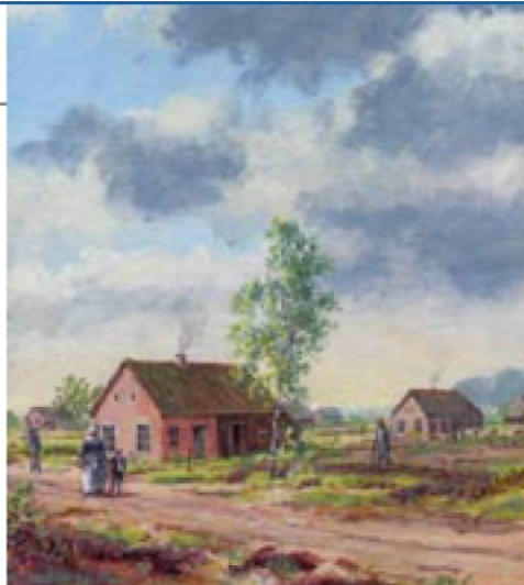
afb. 5. Een impressie van de proefkolonie door G. Schreuder, uit De proefkolonie .

heid van de vrouw van Johannes Verbeek, die zich juist, op bekomen verlof, ten gevolge van goede oppassing, met twee van hare kinderen, sedert eenige dagen, binnen deze stad bevond, om haare naast-bestaanden en vrienden te bezoeken, aan wie zij, evenals aan de sub-commissie, die haar, met haren man en hare kinderen, nu ruim zes maanden geleden, naar de kolonie had afgezonden, de naïfste verhalen van de kolonie gedaan heeft, en vervuld was van dankbaarheid, zoo als zij dit aan een ieder en ook in het openbaar betuigd heeft, voor de weldaad, aan haar huisgezin bewezen, waardoor het de Goddelijke Voorzienigheid behaagd had, hare wankele gezondheid te herstellen en haar uit diepe armoede tot een “gelukkig en nuttigen stand te verheffen”.