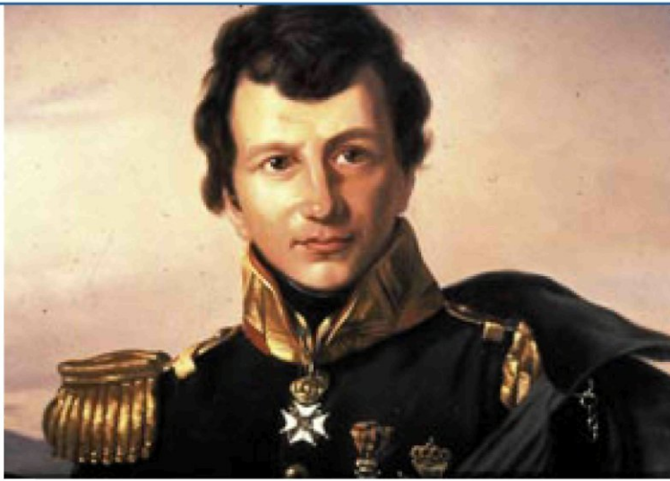
afb. 3. Generaal-majoor Johannes van den Bosch was de man achter de ambitieuze plannen van de landbouwkoloniën.

van vijftien voet bij vijftien voet, dat wil zeggen viereneenhalve meter in het vierkant, die 'de haard' wordt genoemd, omdat er een open stookplaats is. Daarin kon met een pan worden gekookt. Een hedendaagse makelaar zou het huisje een 'éénkamerwoning met open keuken' noemen. Na enige maanden komt er een houten schuur aan de achterzijde van het huisje bij.