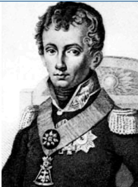
afb. 1. Prins Frederik, de jongste zoon van koning Willem I, was voorzitter voor het leven van de Maatschappij van Weldadigheid. (Cultureel Maçonniek Centrum Prins Frederik, Den Haag)

ook de 'Subcommissie van Weldadigheid Rotterdam' haar werkzaamheden is begonnen. De Maatschappij wil niet met elke subcommissie in elk gehucht of elke vlek afzonderlijk corresponderen. Dat is begrijpelijk, want binnen anderhalf jaar bestaan er al meer dan zevenhonderd subcommissies. Daarom krijgt de Rotterdamse commissie de taak contacten tussen de dorpscommissies in haar regio en de landelijke leiding te onderhouden. Het arrondissement Rotterdam telt dertig subcommissies en heeft het eerste jaar 879 contribuanten. Daarvan komen er 490 uit de stad. Het enthousiasme in de kleinere plaat-