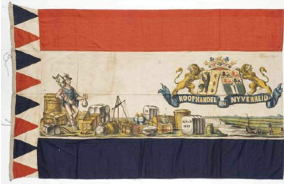
afb. 4. Vlag, vervaardigd door W. Wolff. Links Mercurius te midden van vaten en kisten, rechts een gezicht op een binnenwater. (MMR, M1 644, bijlage nr 21)

schipper J. Griep (1798-1898) die vanaf 1829 een beurtvaartdienst op Rotterdam onderhield. 58 De wimpel werd enige jaren geleden geveild bij het Zeeuws Veilinghuis te Middelburg en bevindt zich nu in particulier bezit (bijlage nr 2).