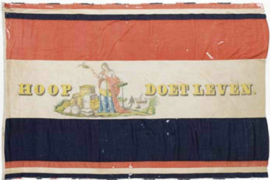
afb. 7. Vlag, vervaardigd door F.H. Pijnappels. De 'Hoop' is afgebeeld met het kenmerkende anker als haar symbool. In haar rechterhand houdt zij een staf vast –feitelijk het attribuut van Mercurius. (MMR, M1633, bijlage nr 23)