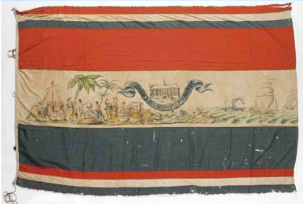
afb. 5. Vlag met West-Indische figuren, mogelijk door kapitein J. Louwerens van rederij Anthonie van Hoboken aangeboden aan de beurtschipper van de Vrouwe Margaretha . De West-Indische figuren op deze vlag verwijzen wellicht naar de pogingen die Van Hoboken in 1801 en kort na 1814 ondernam om handel met Zuid-Amerika te drijven. Vermoedelijk vervaardigd door F.H. Pijnappels. (MMR, M1806, bijlage nr 17)

beurtvaarder De Vrouw Maria met de signatuur 'F: H: Pijnappels Rotterdam' (bijlage nr 18). 61