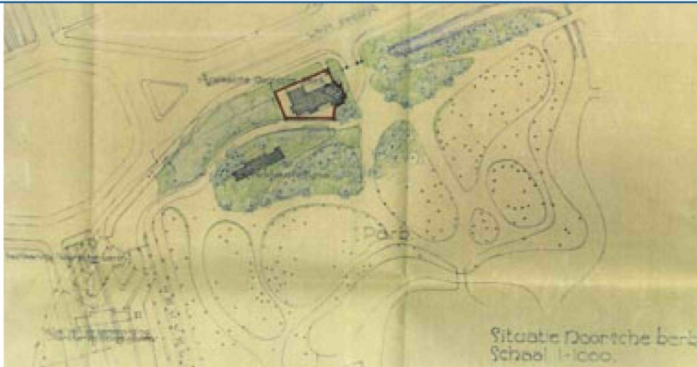
afb. 9. Schets van de voorgestelde verhuizing van de Zeemanskerk in verband met de aanleg van de Maastunnel, uitgewerkt door de Gemeentelijke Technische Dienst in 1936. Links de oorspronkelijke ligging van de kerk; in het midden van de kaart de nieuwe ligging bij de ingang van het Park. (schets in archief Sjømannsmisjonen, Statsarkivet Bergen)

ders, die gewend waren aan de kenmerkende witte wanden van de Protestantse kerken hier te lande, verrassend zijn geweest.