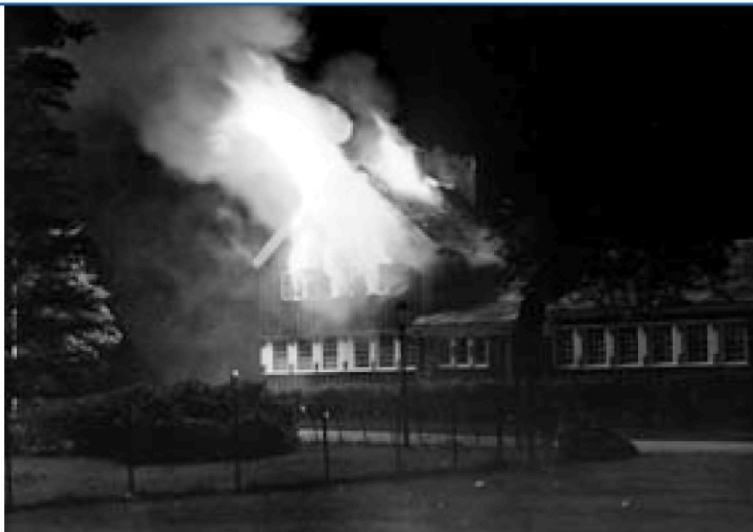
afb. 14. De Zeemanskerk overleefde het bombardement van 1940, maar werd op 3 oktober 1941 getroffen door een Engelse brandbom. De bom ontplofte op de zolder van de pastorie en het vuur verspreidde zich snel door het houten gebouw. De pastorie en leeszaal werden verwoest, maar al tijdens de oorlog weer herbouwd. Op 15 november 1942 kon het gebouw weer in gebruik genomen worden.

manspastor Ursin bij een Rotterdamse anti-quair een schilderij gekocht van Christus aan het kruis in de stijl van de Vlaamse schilder Antonie van Dijck (1599-1641). De omlijsting van het schilderij, in barok-achtig houtsnijwerk, werd door Domenico Erdmann ontworpen en beschilderd, in een stijl die paste bij de wandbeschildering die twintig jaar eerder was aangebracht door dezelfde kunstenaar. Wegens de vele veranderingen werd het kerkgebouw op 14 november 1937 opnieuw plechtig ingewijd. 25