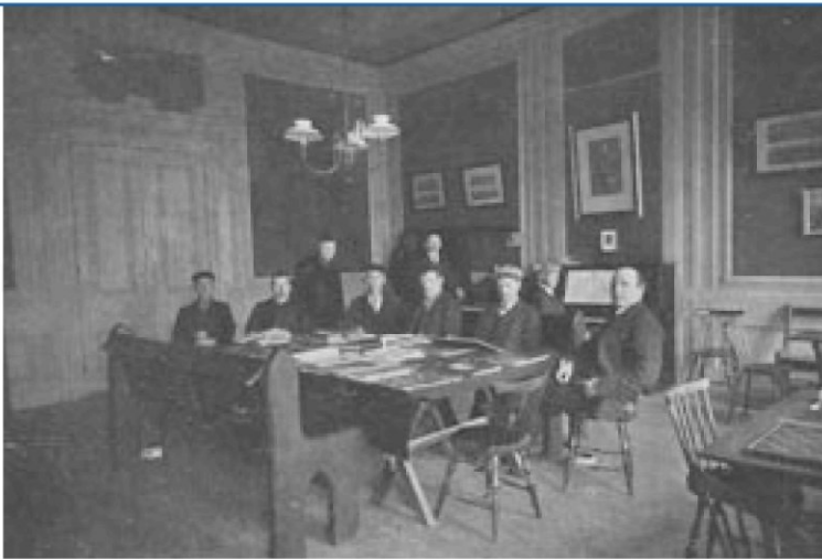
afb. 5. Zeelieden in de leeszaal van de Noorse Zeemansmissie, Boompjes 92. Hier konden Noorse zeelieden tijdens een verblijf aan wal Noorse kranten en boeken lezen, of brieven naar huis schrijven. De leeszaal bood een rustig en veilig alternatief voor de kroegen, danshuizen en bordelen die in in de Zandstraatbuurt en rond de Schiedamsedijk alom aanwezig waren en waar de zeeman ten prooi kon vallen aan uitbuiters en oplichters. Deze prentbriefkaart dateert waarschijnlijk van rond 1910.