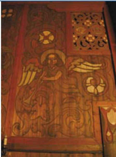
afb. 12. Detail van een engel, aan de noordwand van de kerk. (foto Marion Busch, 2009)