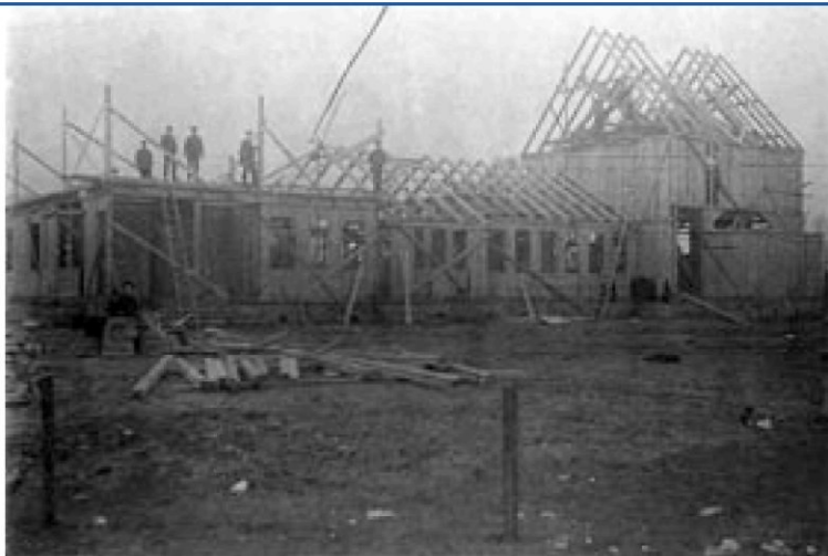
afb. 7. Foto van de kerk in aanbouw, gemaakt op 16 februari 1914. De bouw van de kerk werd uitgevoerd door het Noorse bedrijf Strømmen Trævarefabrik, dat gespecialiseerd was in het leveren van 'bouwpakketten' voor houten gebouwen. De planken werden op maat gezaagd en per schip vervoerd naar Rotterdam. Timmerlieden van het bedrijf reisden mee om de kerk ter plaatse op te bouwen. De inwijdingsceremonie vond plaats op 26 juli 1914.