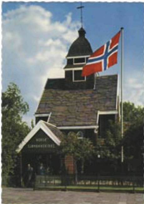
afb. 1. Ansichtkaart van de Noorse Zeemanskerk, waarschijnlijk uit de jaren zestig, met de Noorse vlag prominent op de voorgrond. Later is er voor de Nederlandse vlag een tweede vlaggenstok bijgekomen. De kerk staat sinds 1937 op deze plaats aan de Westzeedijk, bij de ingang van Het Park. Door een latere verhoging van de Westzeedijk ligt de kerk nu op een wat lager niveau dan de straat. Op het voorportaal staat de tekst Norsk Sjømannskirke, Noorse Zeemanskerk.

tachtig procent van de Noorse bevolking lid van de staatskerk.