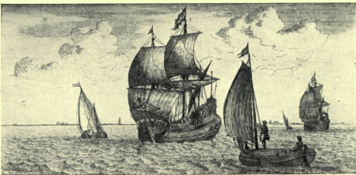
17. Het postjacht komt op zij van de fleuyt.