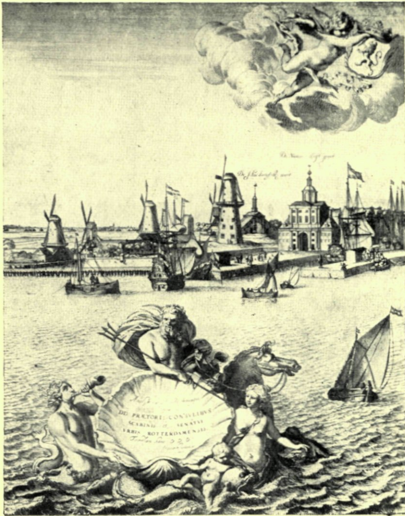
16. PANORAMA VAN ROTTERDAM DOOR JACOB QUACK, 1665. BLAD I.