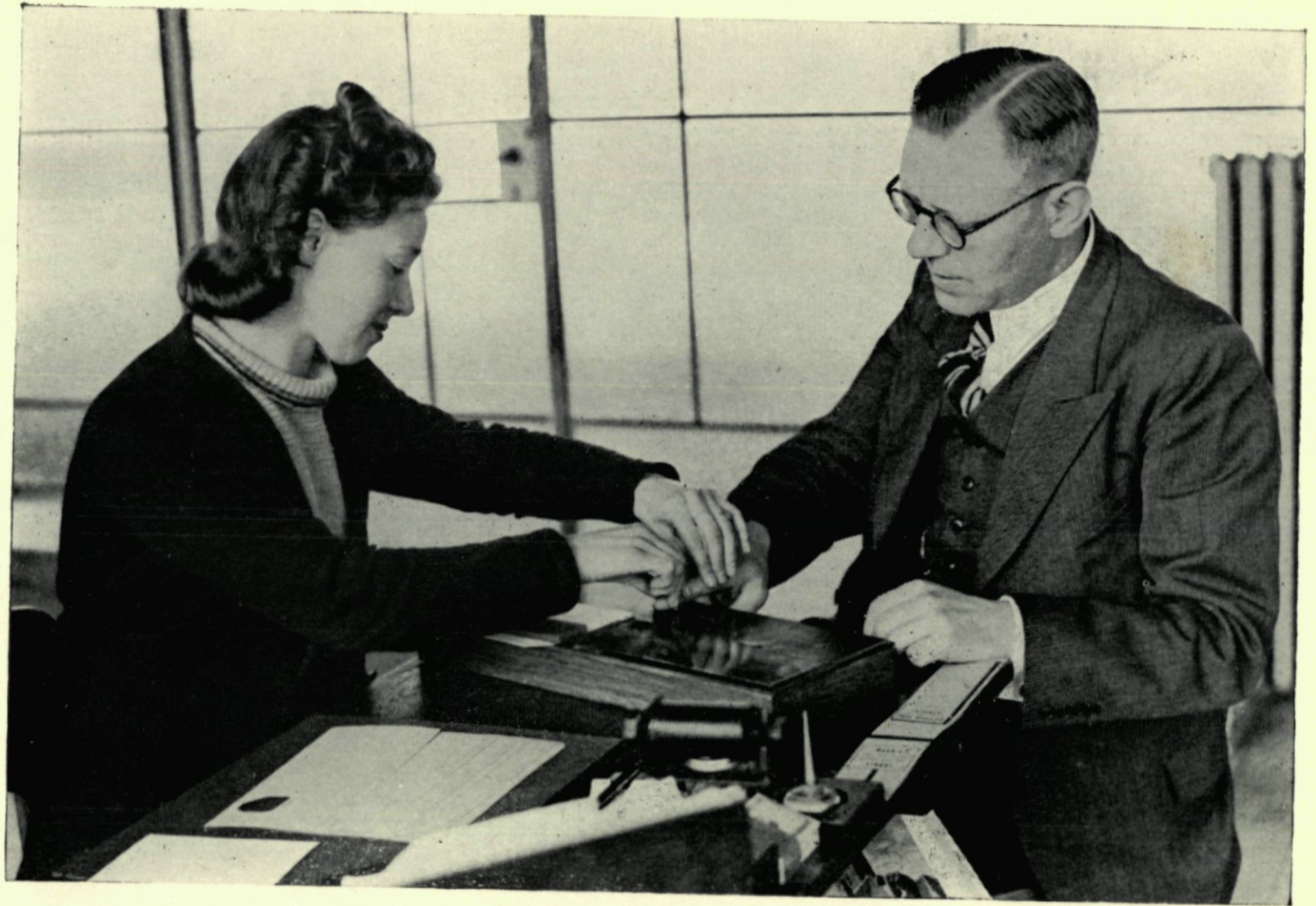
6. Ritus bij de uitreiking van persoonsbewijzen.