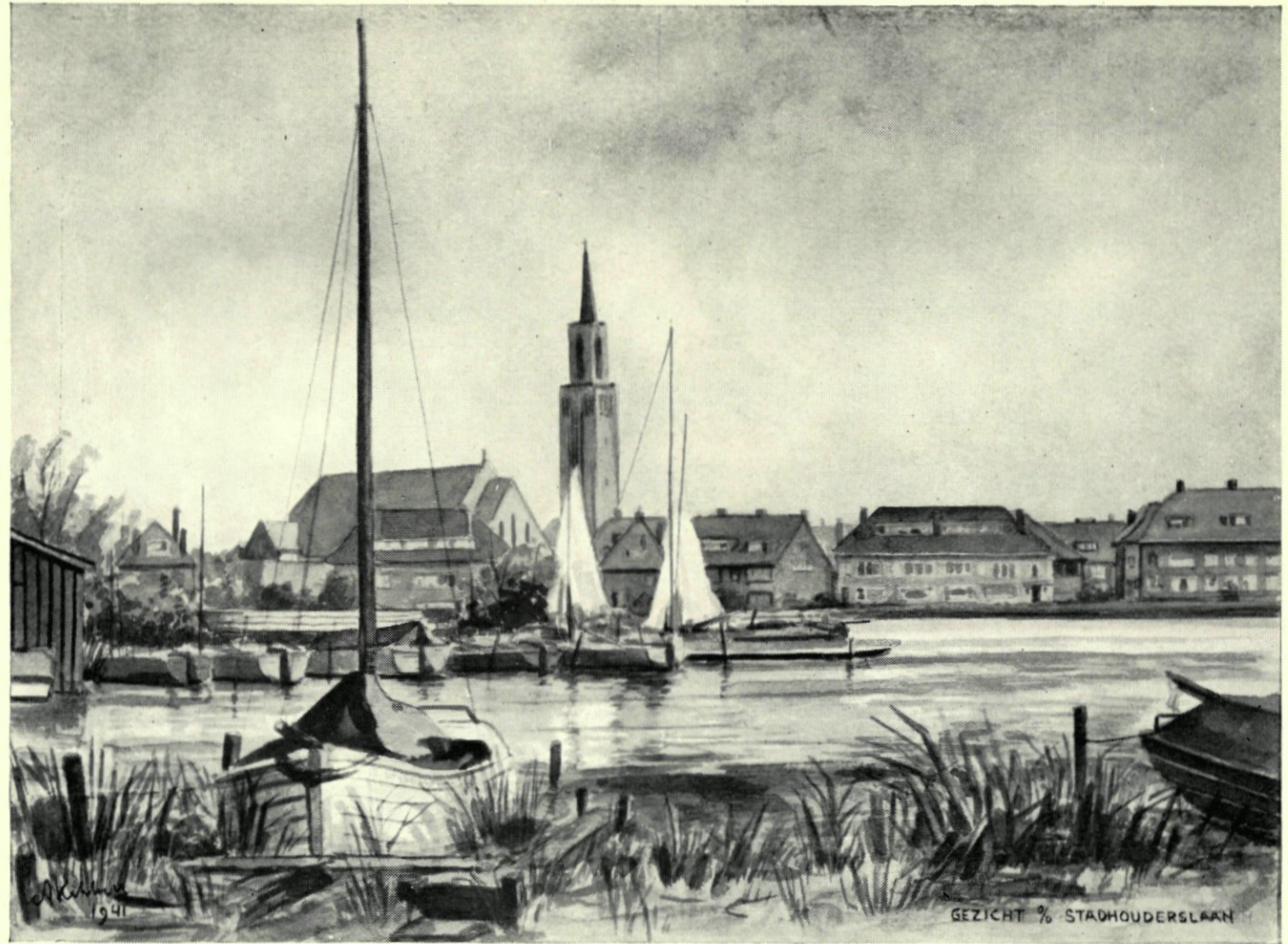
7. Hillegersberg. De Stadhouderslaan met de Christus-Koning-kerk. Naar een aquarel van A. Kikkert.