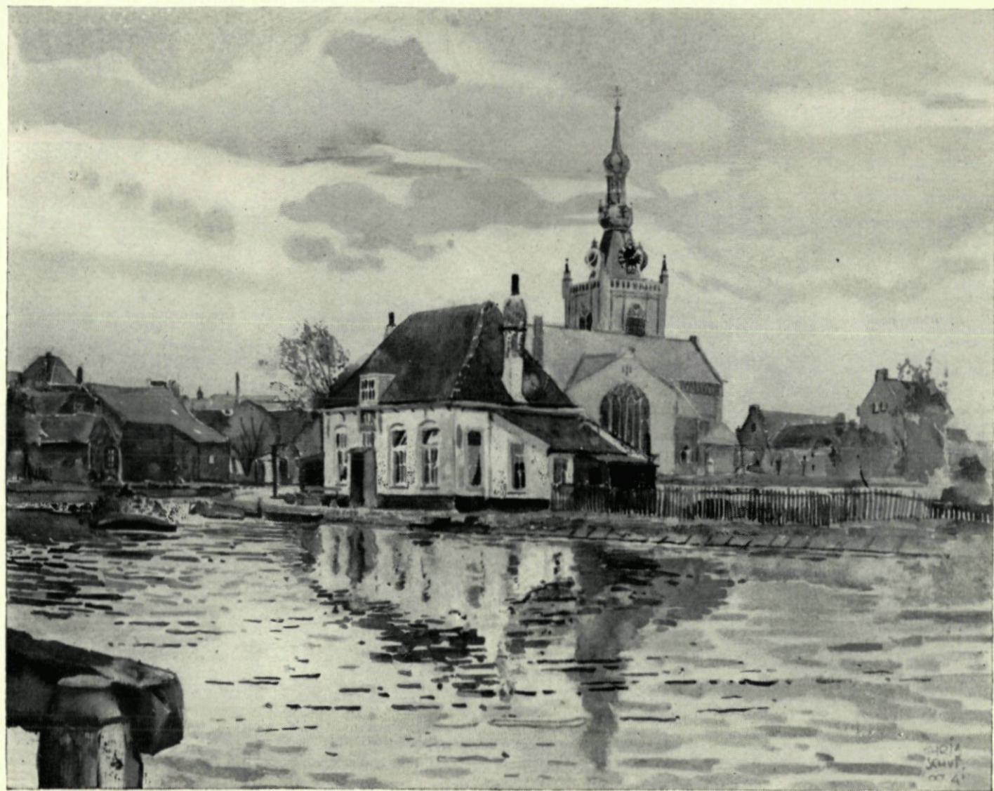
8. Overschie. De Delftsche Schie bij het veerhuis. Naar een aquarel van Chris Schut.