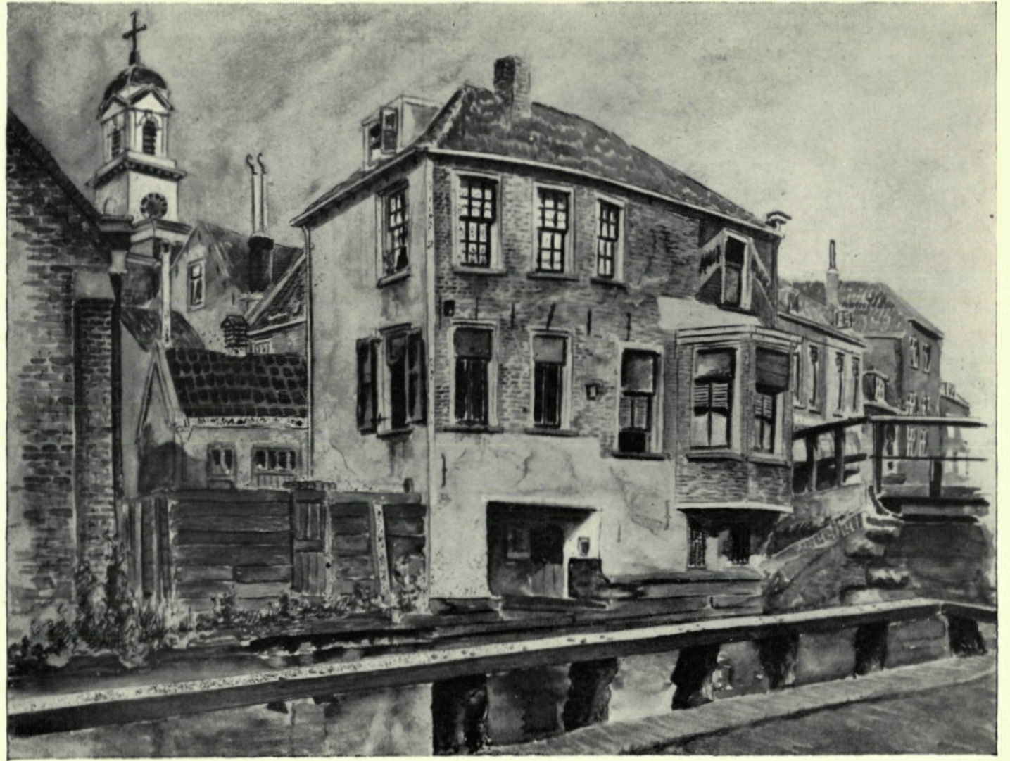
9. Overschie. De Rotterdamsche Schie tusschen de Lagebrug en de Schie. Naar een aquarel van J. Corsten.