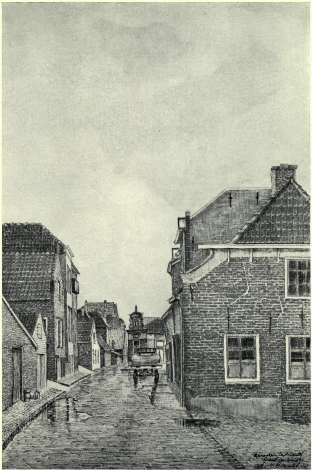
10. IJsselmonde. De Benedenstraat. Naar een aquarel van A. I. Cornelis.