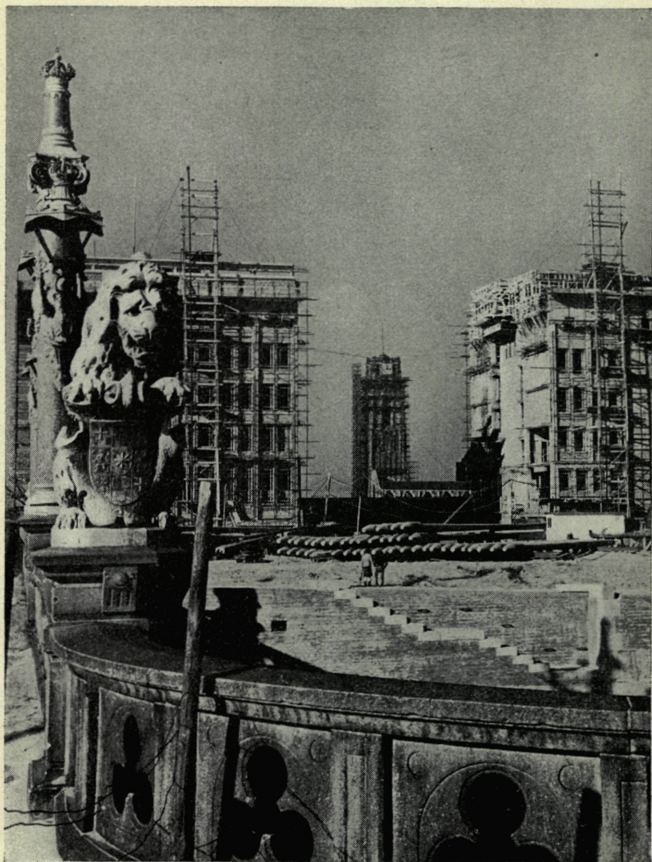
1. Bankgebouwen langs de Blaak, gezien van de Regentessebrug af.