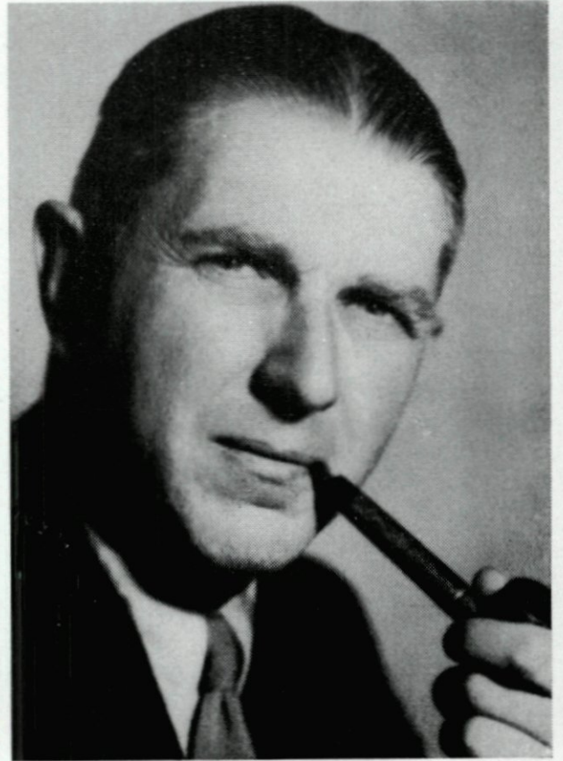
63. F. Pot