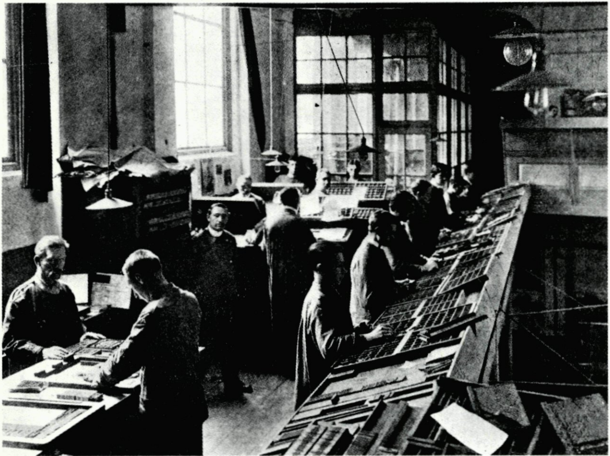
66-67. Dagblad De Rotterdammer in het kerkgebouw aan de Goudsesingel, ca. 1915. De drukkerijhal in het schip; onder: de handzetterij op de 'gaanderij'.