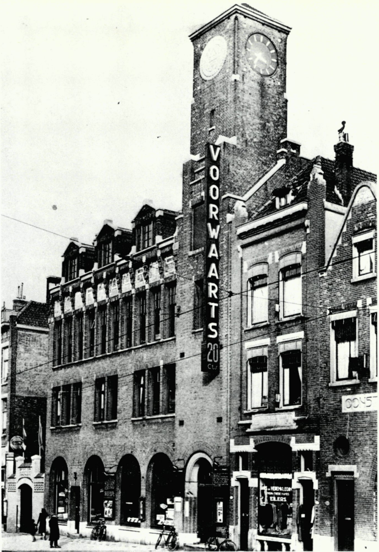
68. Het bij het bombardement van Mei 1940 verwoeste gebouw van de Voorwaarts aan de Gedempte Slaak.