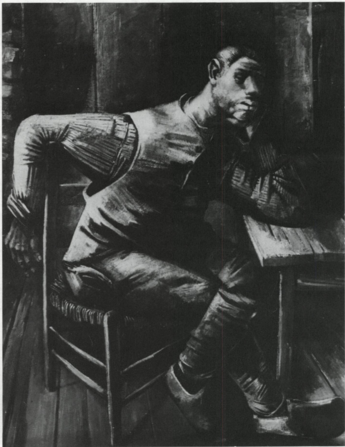
59. Schilderij 'Tuinder' van Hendrik Chabot; foto collectie D. Tol, Chabotmuseum Rotterdam.