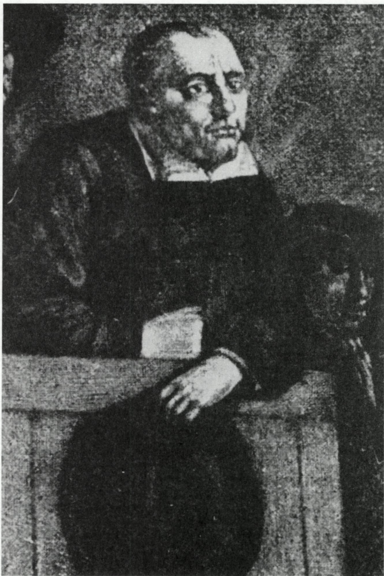
55. Benjamin Furly. ('Supposed portrait of Benjamin Furly'; detail van het schilderij 'Bijeenkomst van Quakers' van Egbert van Heemskerk, zie afb. 56.)