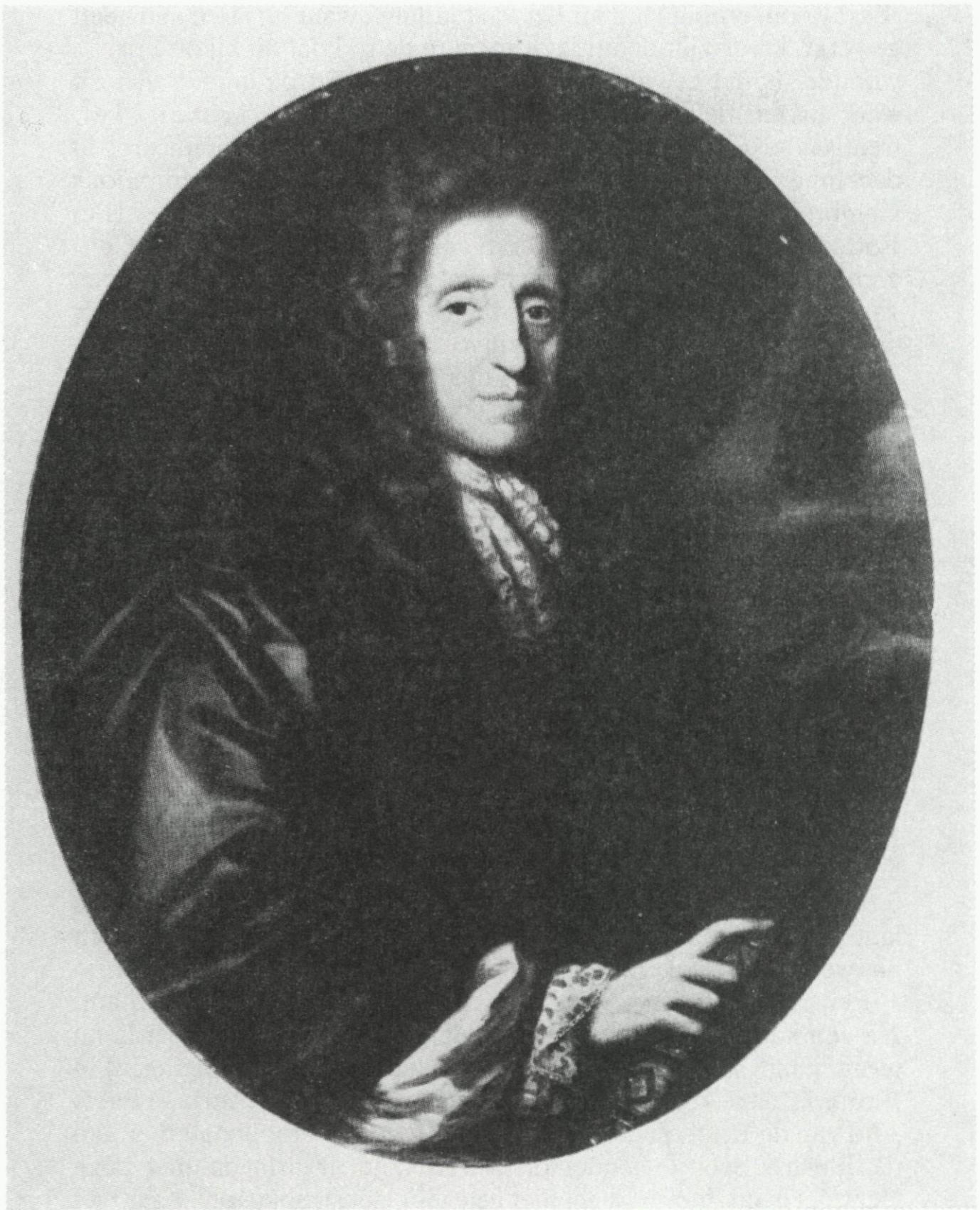
58. John Locke. Portret door Herman Verelst, 1689.