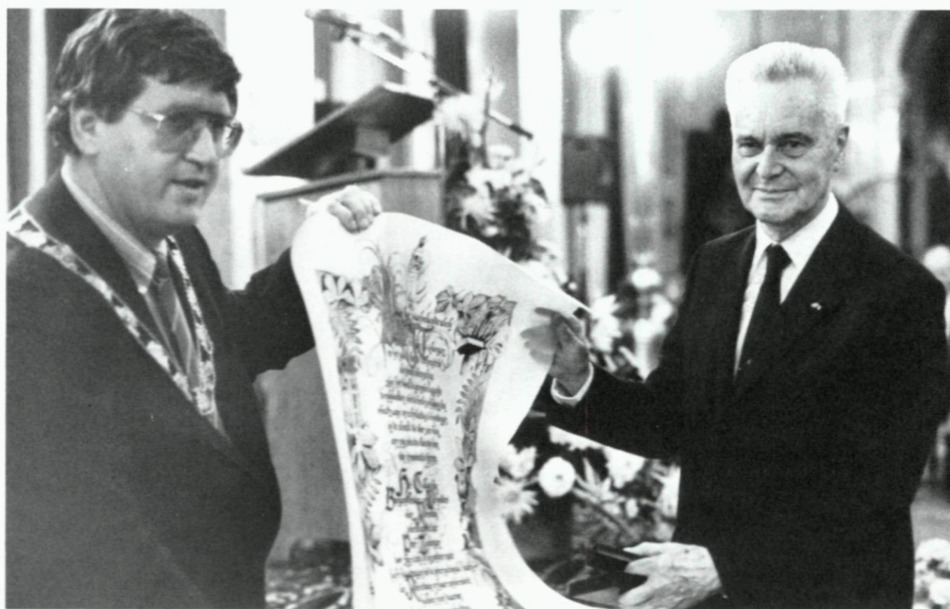
35. Demonstratie in de Gouvernestraat, bij theater De Lantaren, tegen opvoering van het toneelstuk 'Het vuil, de stad en de dood'; 18 november. 36. Prof. dr. J. Tinbergen ontvangt van burgemeester Peper de bij de Van Oldenbarneveltpenning behorende oorkonde; 19 november.