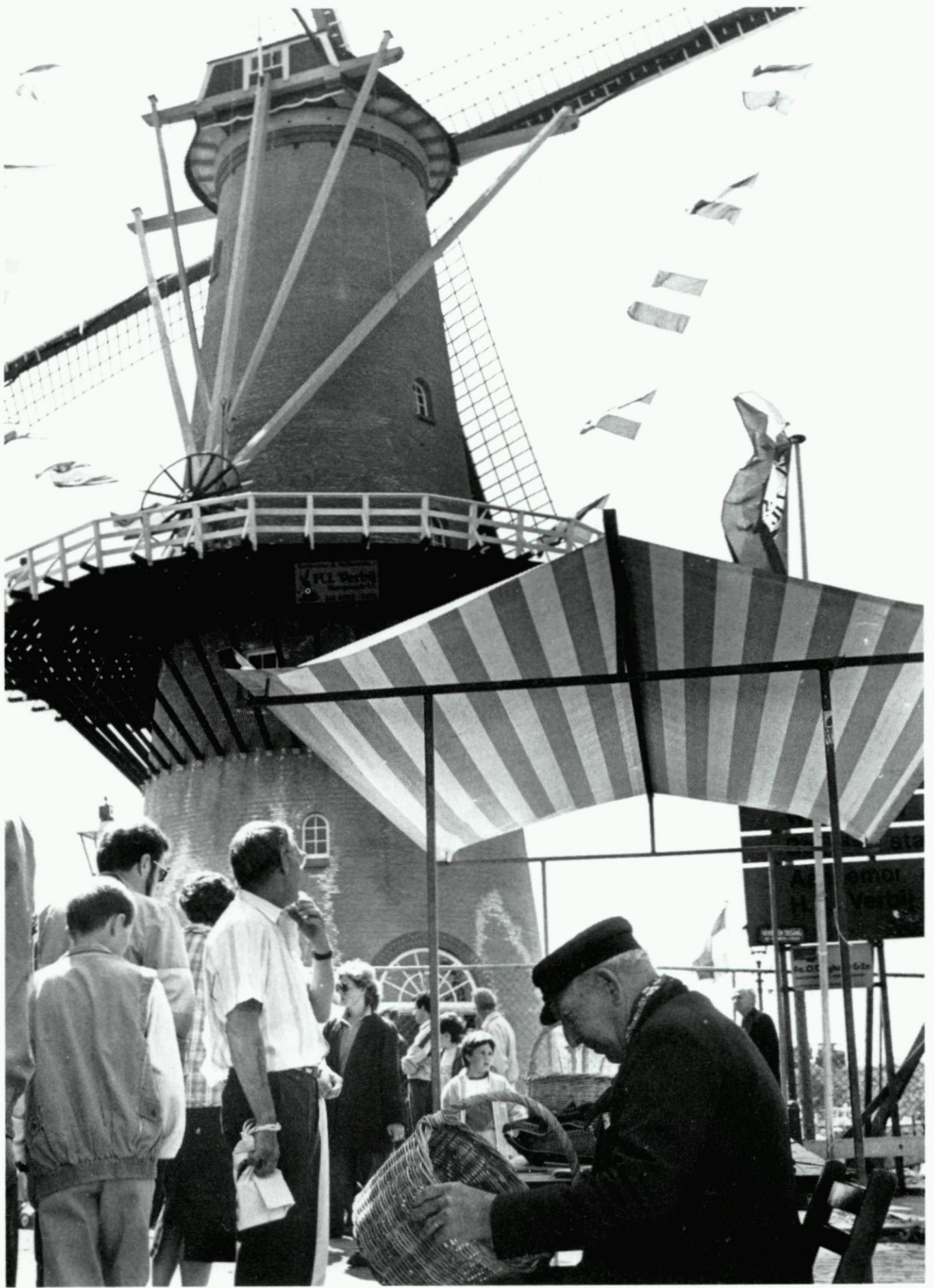
15. Feestelijke ingebruikstelling van de gerestaureerde molen 'De Distilleerketel'; 9 mei.