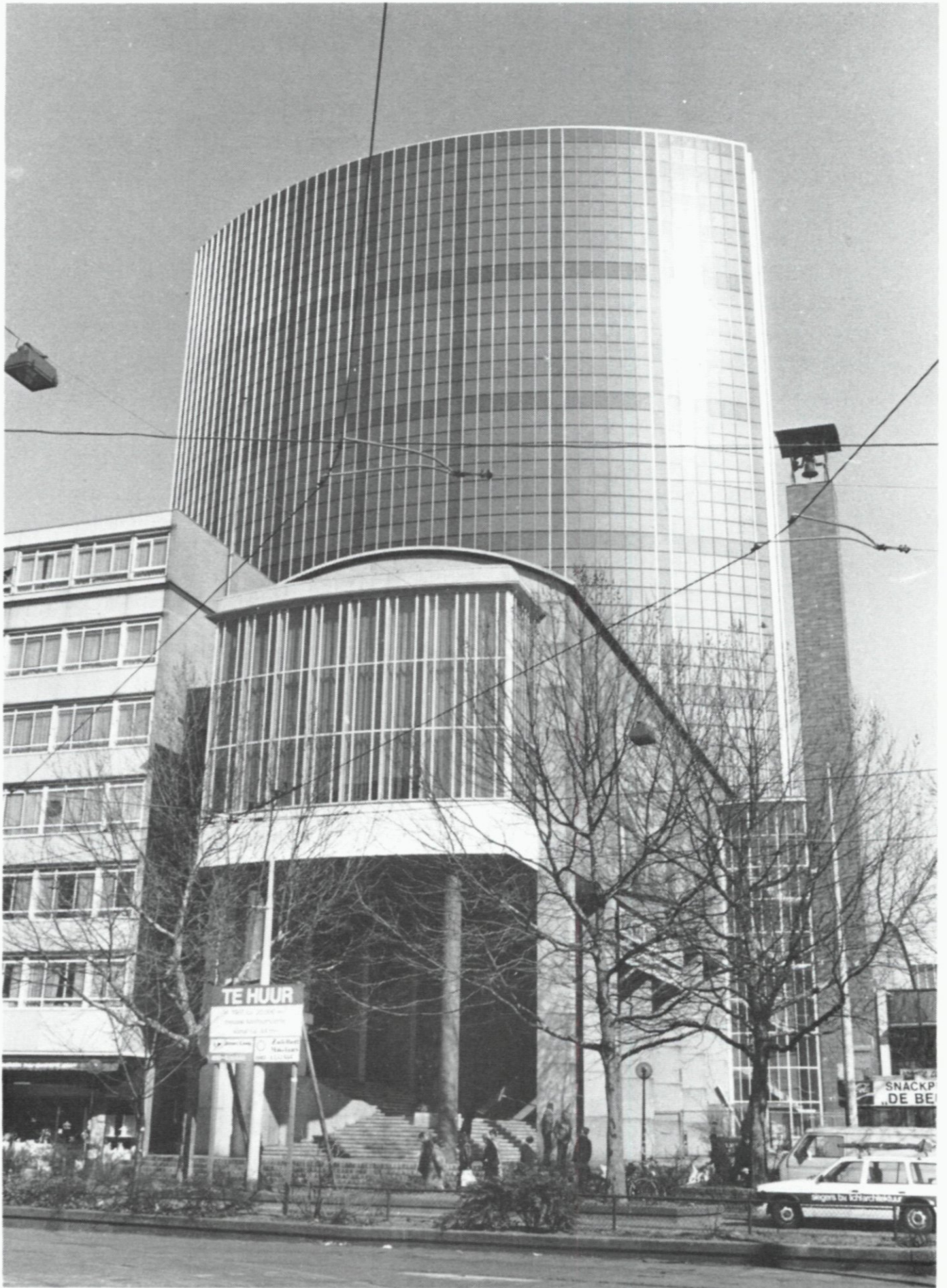
34. Beursgebouw en World Trade Center aan het Beursplein, hoek Coolingsingel; opname maart 1987.