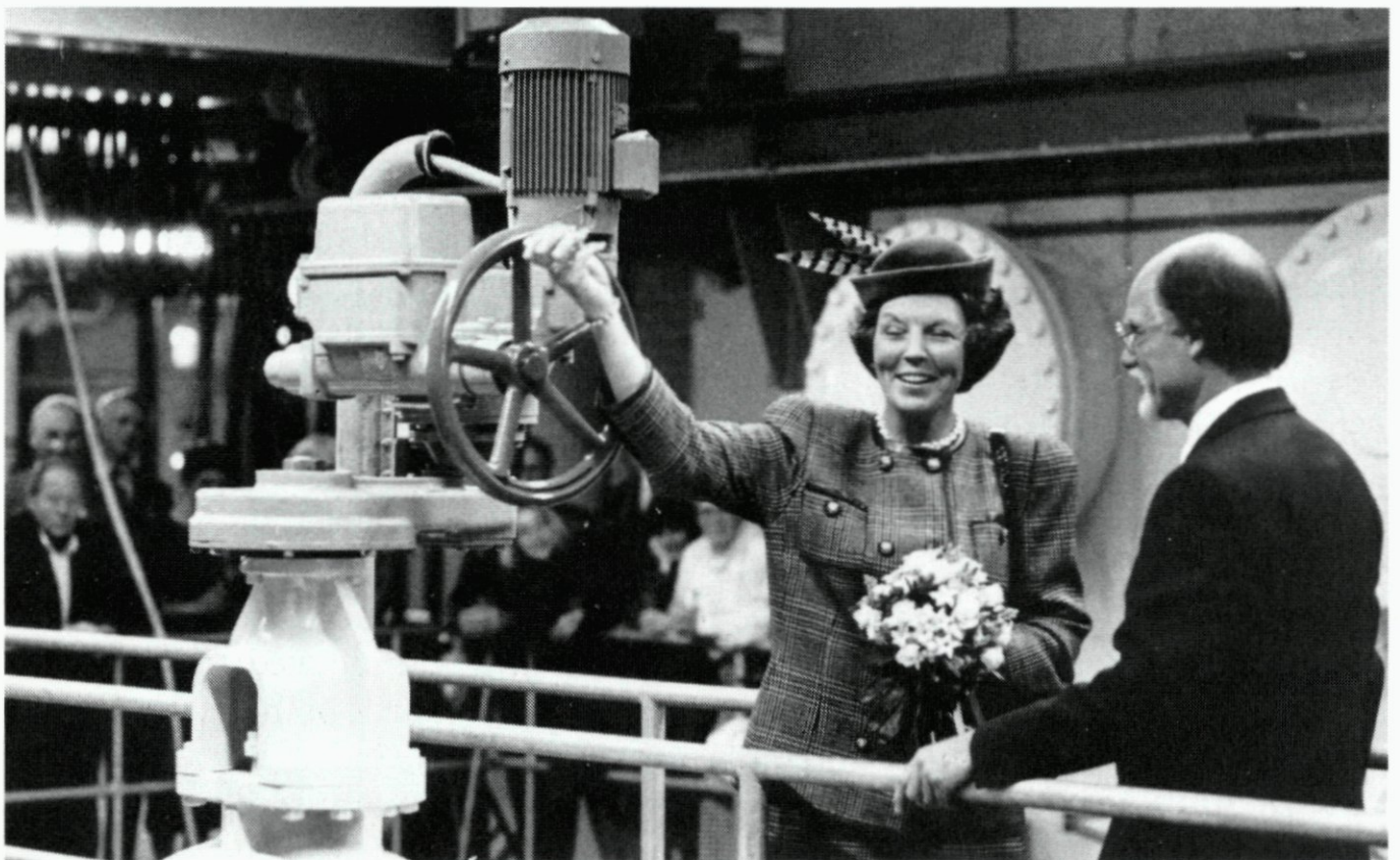
32. Bouwput van de spoortunnel, gezien vanaf de Blaak bij metrostation in de richting van de Hertekade, links de Geldersestraat; opname 29-10-'87. 33. Door het opendraaien van een afsluiter stelt H.M. koningin Beatrix de afvalwaterzuiveringsinstallatie Dokhaven in gebruik, rechts voorz. ir. H.H. Tonkes van het Zuiveringsschap Hollandse Eilanden en Waarden; 3 november.