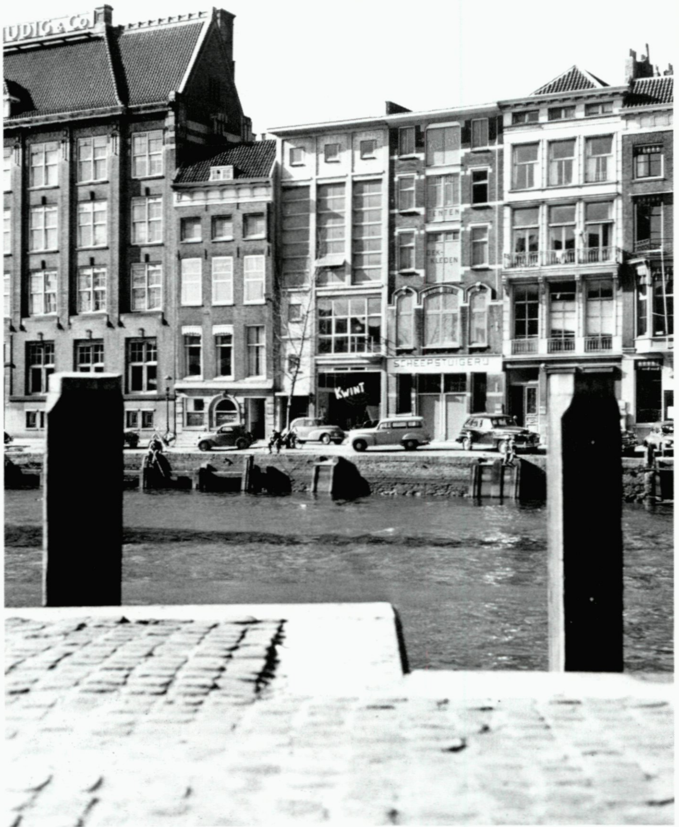
39. De panden Wijnhaven (v.r.n.l.) 13 t/m 23, die plaats moesten maken voor de bouw van de spoortunnel (zie Dagelijkse Kroniek 24 augustus); foto 1954, uit zuidelijke richting.