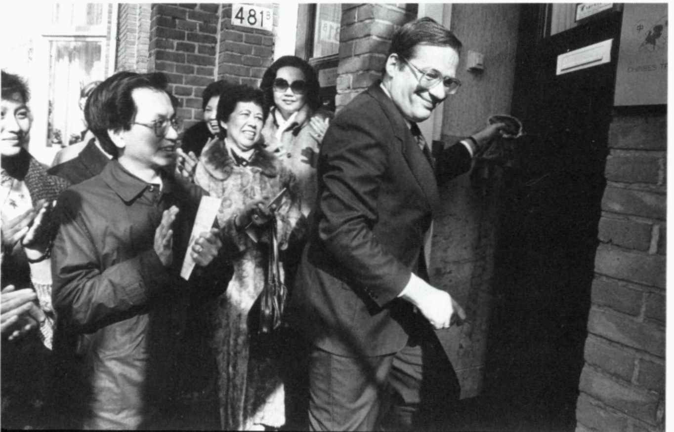
5. De minister-president van Thailand, Prem Tinsulanonda, aan een controlepaneel in de verkeerstoren Geulhaven, naast hem wethouder dr. J.M. Linthorst; 11 maart. 6. Opening van een trefcentrum voor Chinezen door minister drs. W.J. Deetman; 14 maart.