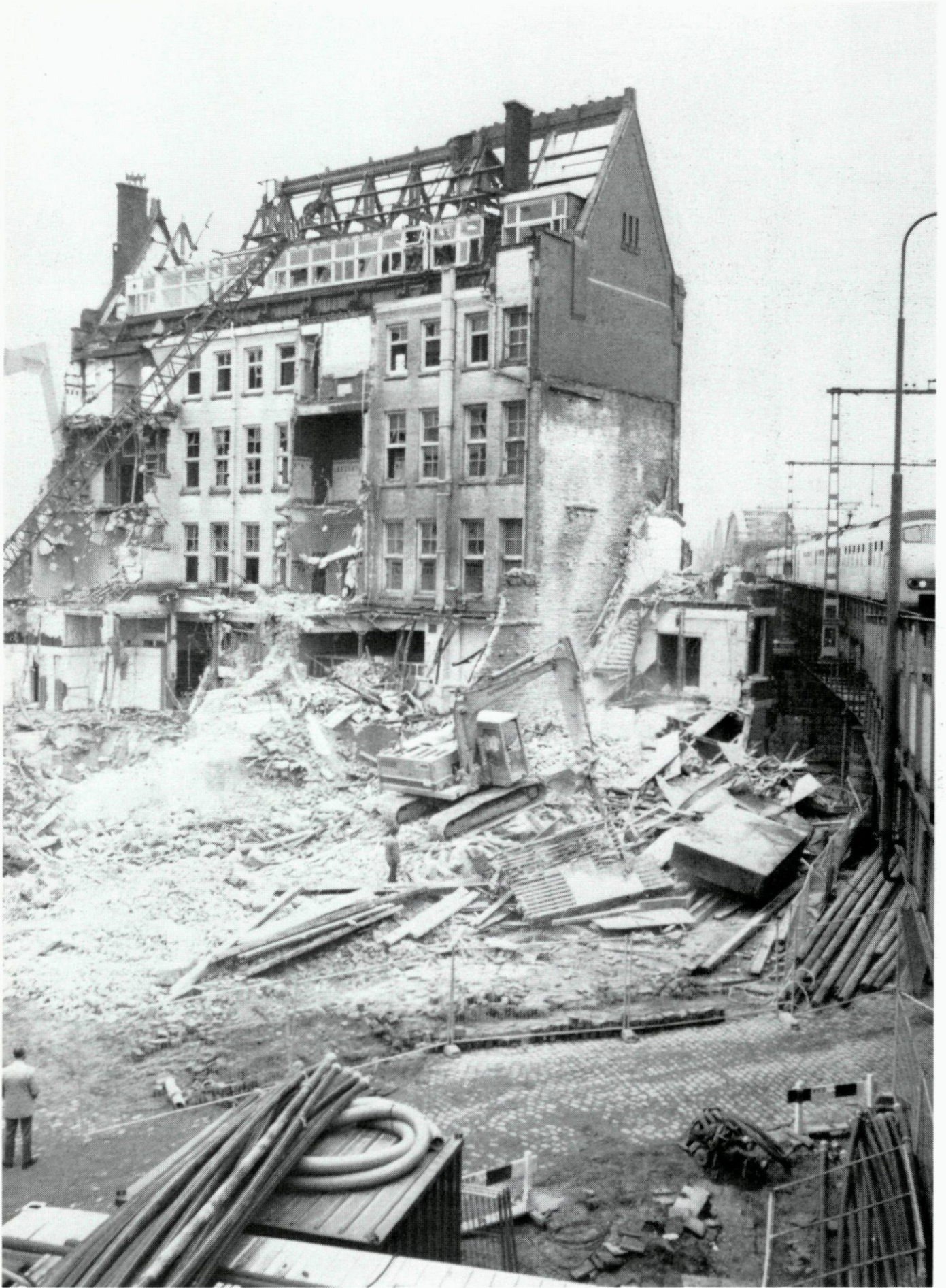
40. Sloop van het laatste gebouw aan de Wijnhaven, het 'Hudigpand' (nr. 23-25); opname 30-11-1987, uit het noordwesten.