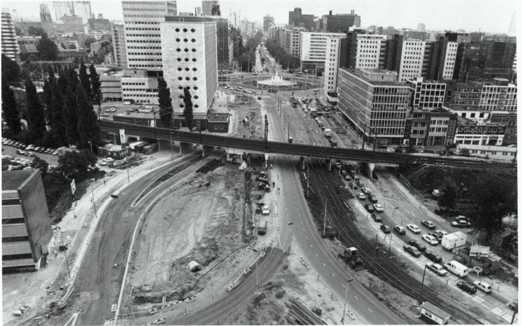
23. Voorbereidende werkzaamheden voor de bouw van de spoortunnel; een overzicht van de Schiekade, richting Hofplein, waar de rij- en trambanen worden verlegd; opname eind augustus 1987.