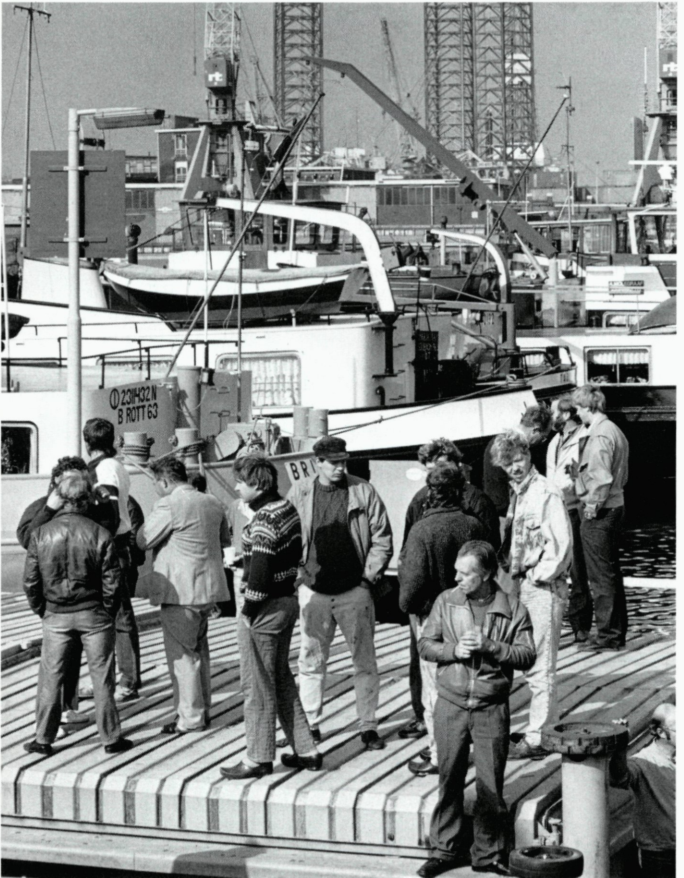
30. Binnenschippers houden in de Rijnhaven een duwbak van Granaria BV bezet; 2 oktober.