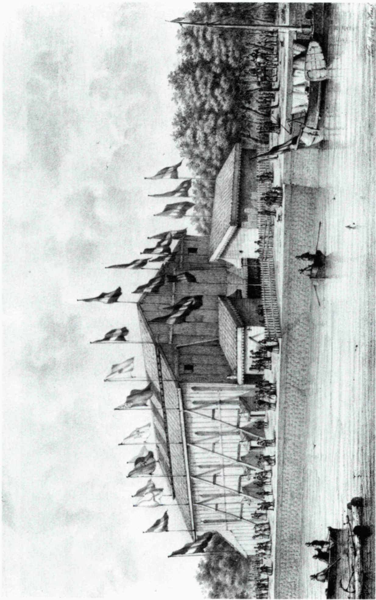
78. Het feestgebouw dat in 1854 t.g. v. het 25-jarig bestaan van de Maatschappij tot Bevordering der Toonkunst werd gebouwd aan het Nieuwe Werk.