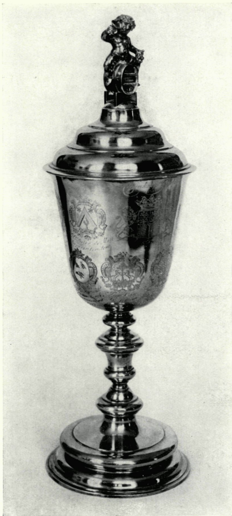
30. Wijnkopers-gildebeker 1717, met het wapen van Jan Osy, hooftman 1718