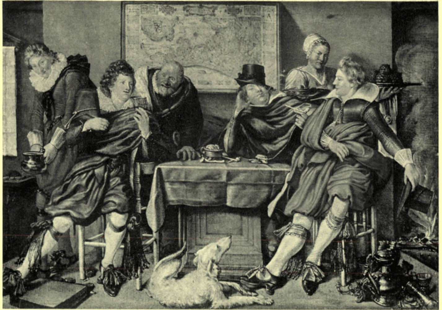
8. VROOLIJK GEZELSCHAP, DOOR WILLEM PIETERSZ. BUYTEWECH, IN HET MUSEUM BOYMANS