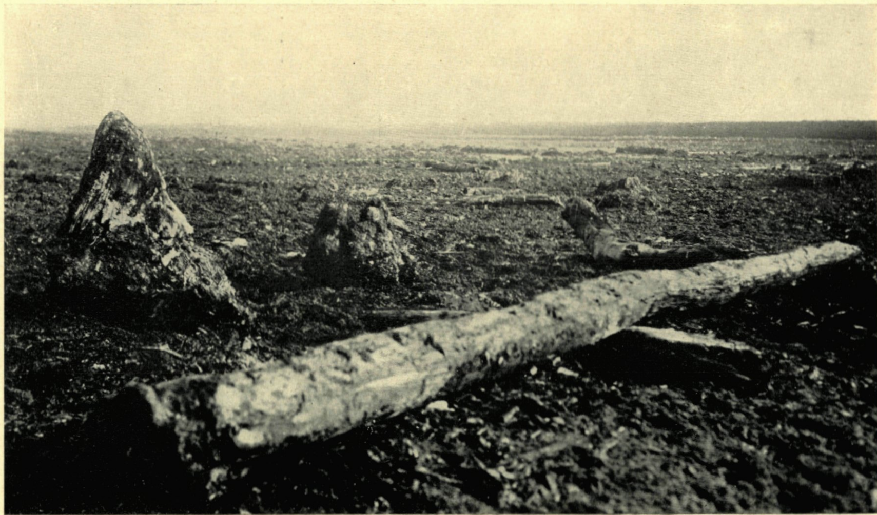
15. OVERBLIJFSELEN VAN HET OERBOSCH BIJ DEN KRALINGSCHÉPLAS