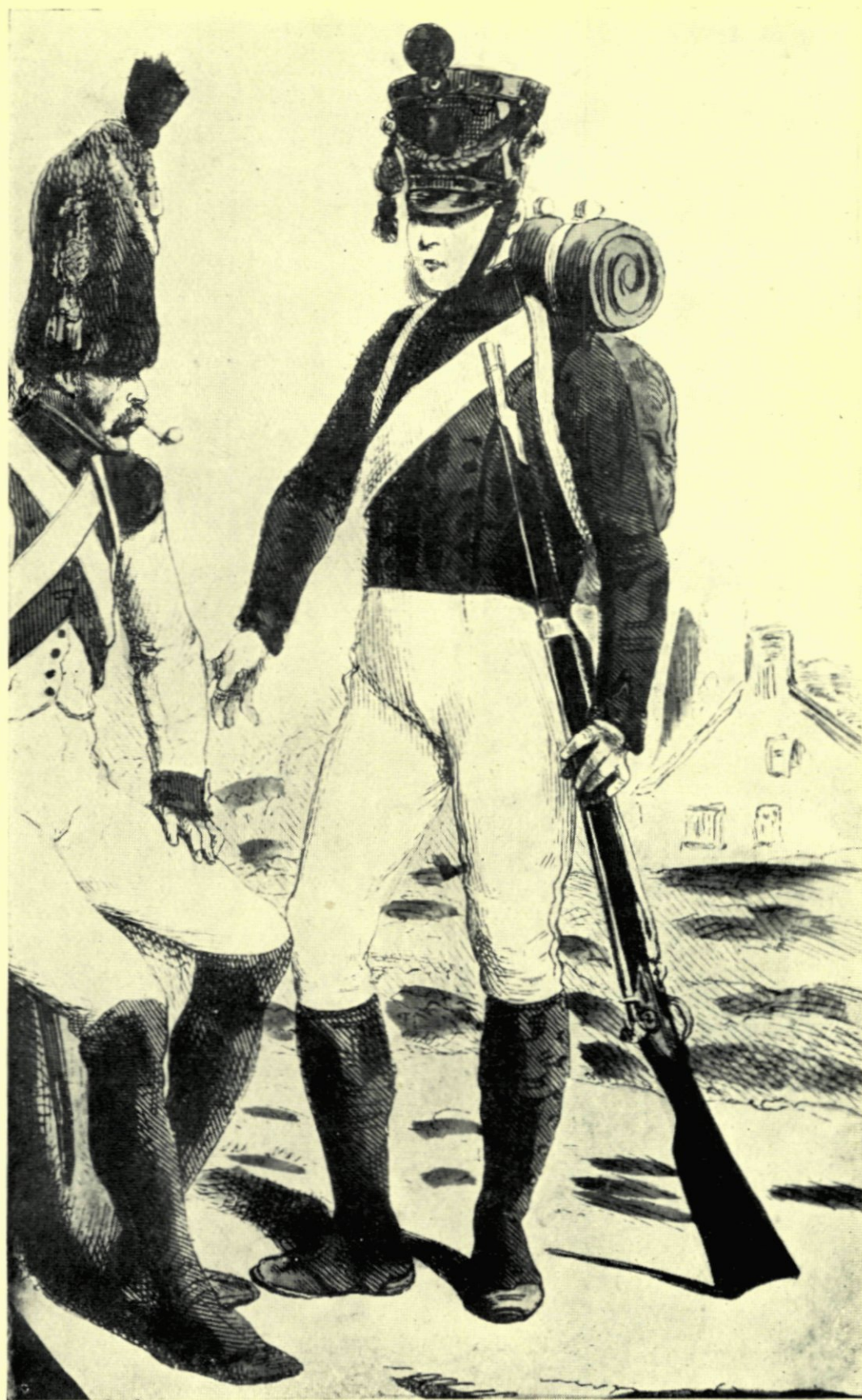
14. EEN HOLLANDSCHE PUPIL IN GROOT TENUE. RECHTSCHIE FIGUUR.