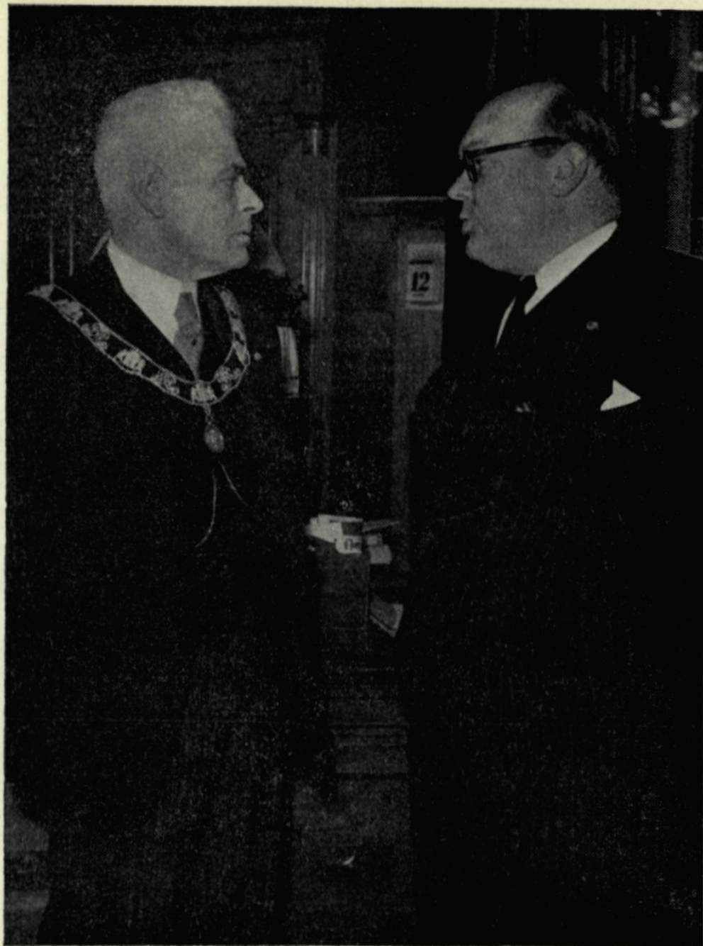
4. Bezoek van de Belgische minister Spaak.