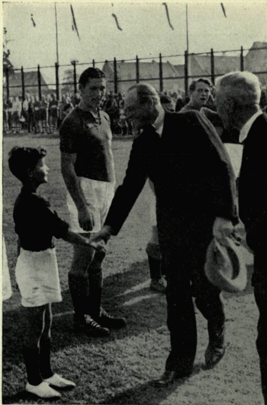
5. Kroonprins Olav opent het voetbalterrein Norge op de Heyplaat.