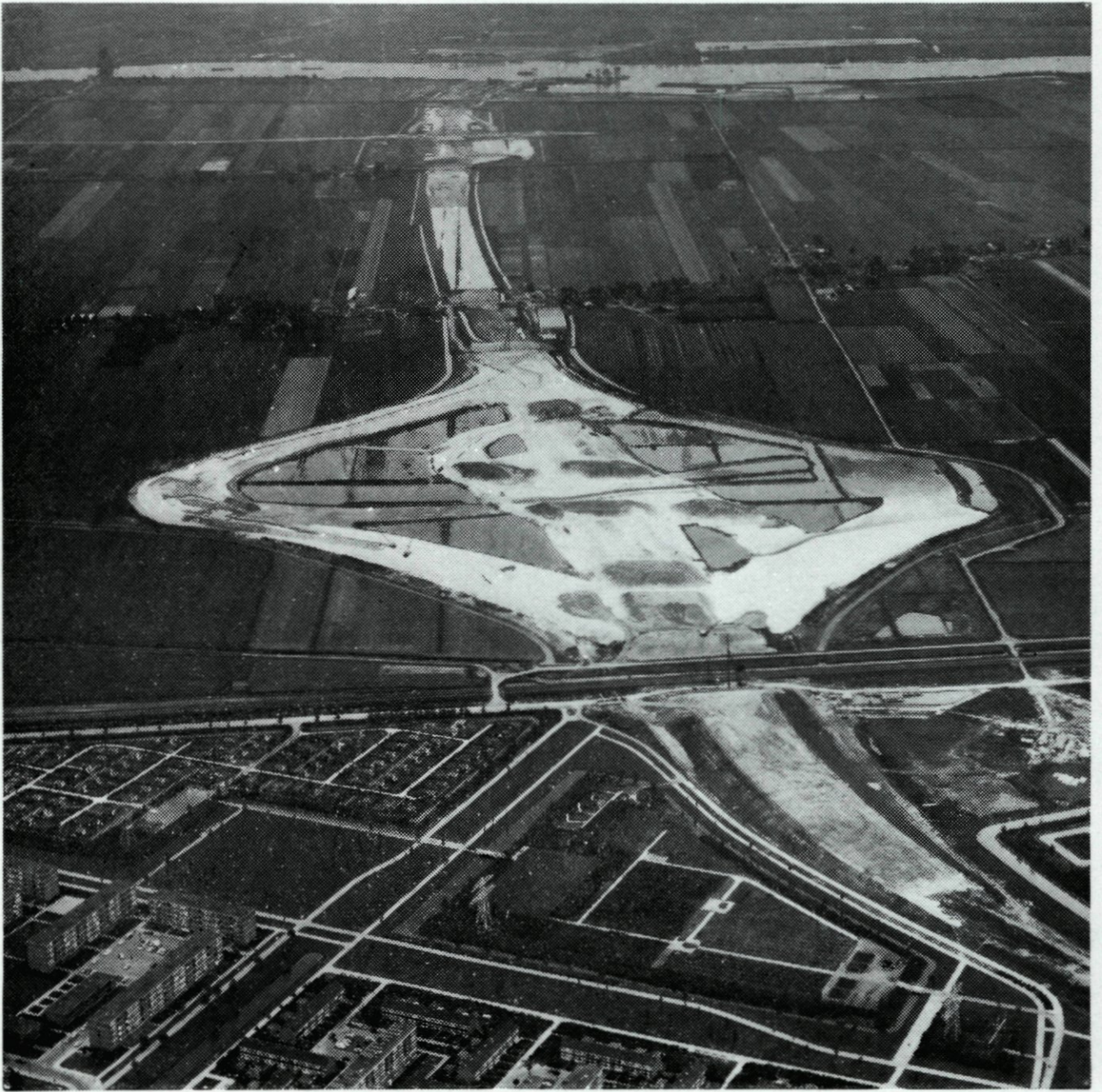
31. De Vaanweg met het verkeersplein in aanleg; op de achtergrond Rijksweg no. 29, aansluitend op de nieuwe tunnel onder de Oude Maas. september, (AC).