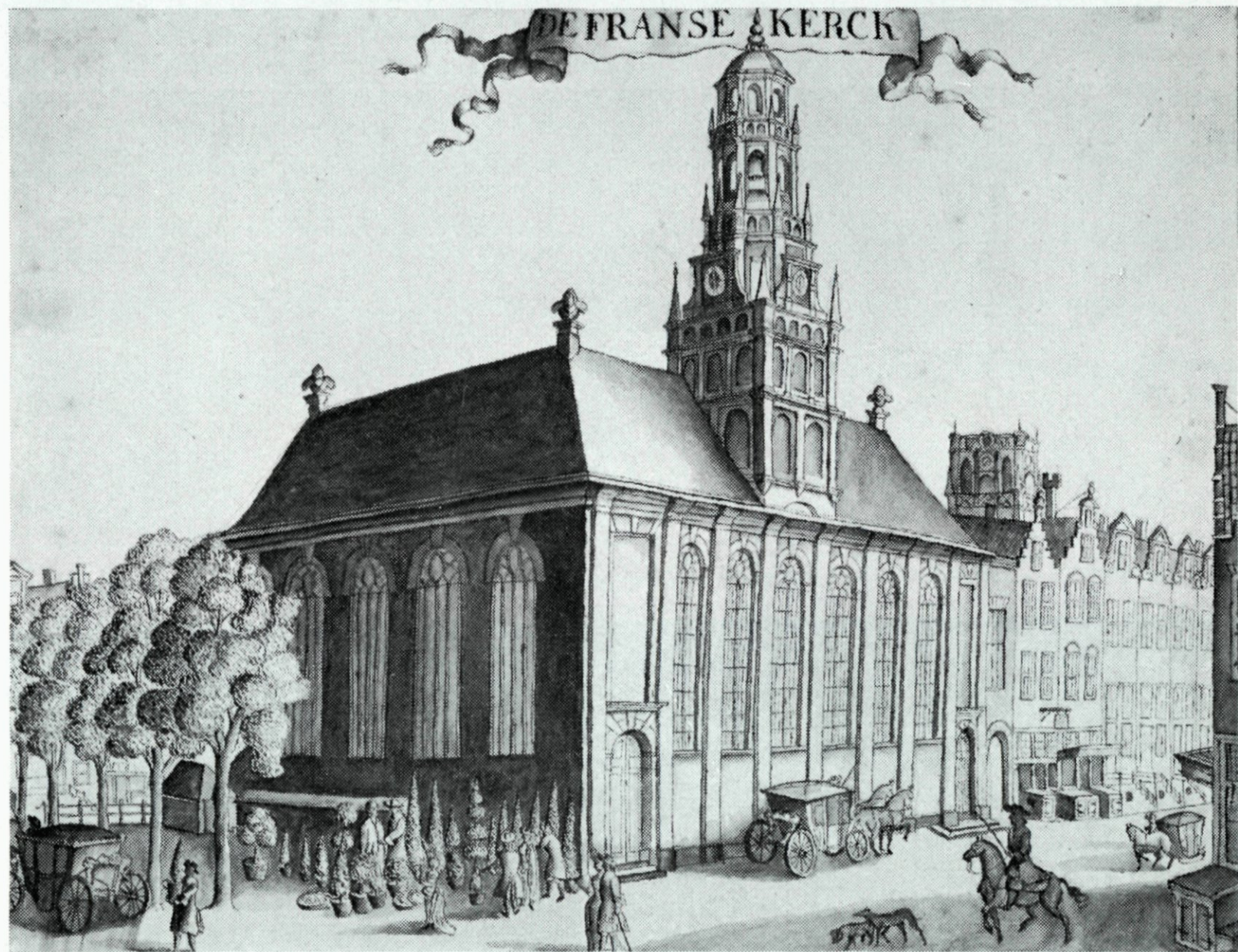
36. De Franse Kerck Anno 1690; naar een tekening in oostindische inkt door J. de Vou.