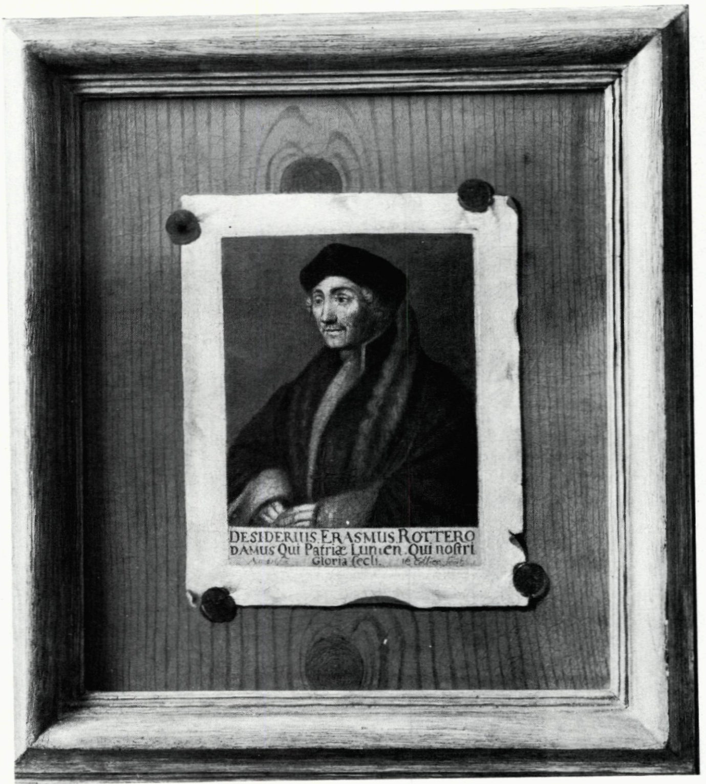
57. Trompe l'oeil met een gravure van Erasmus in het Historisch Museum.