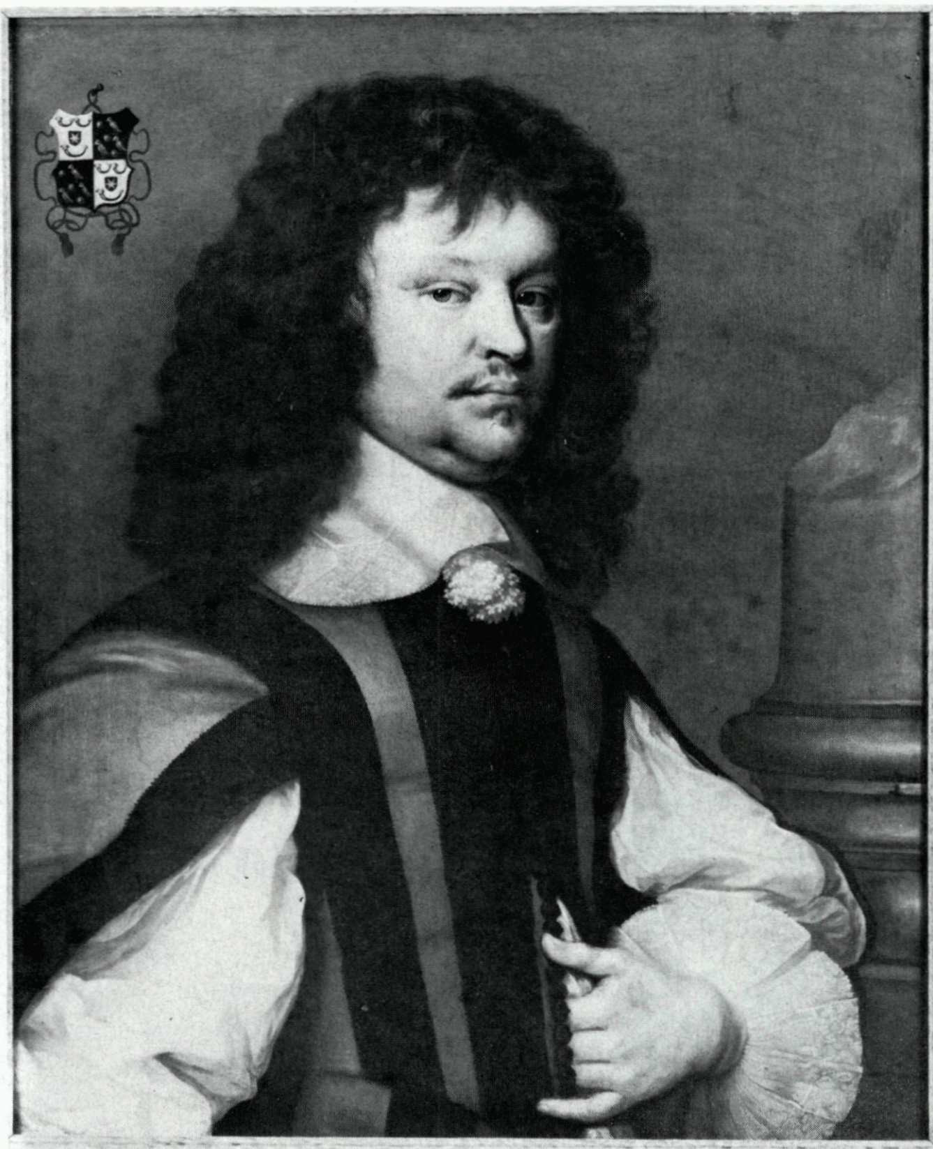
58. Pieter de Groot. Naar een geschilderd portret in het Historisch Museum, in bruikleen van het Rijk.