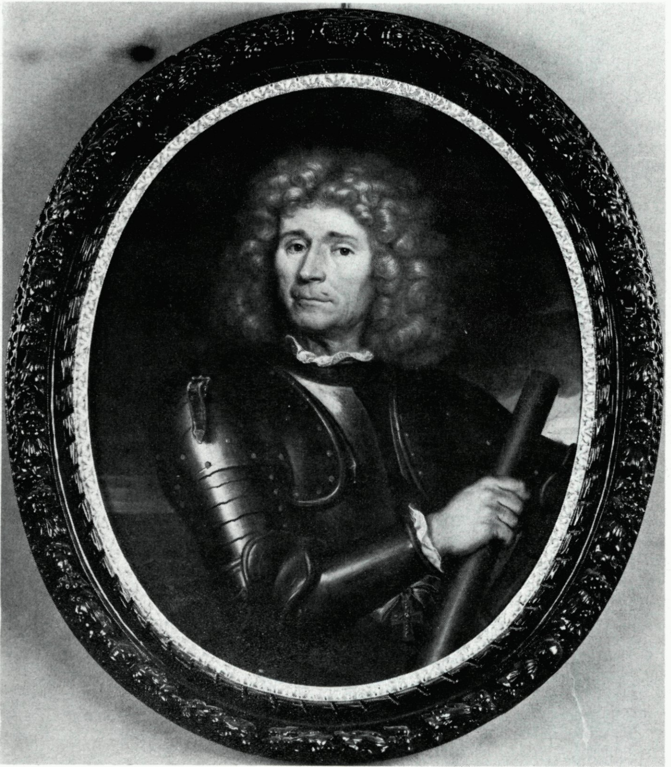
60. Willem Bastiaensz. Schepers. Naar een geschilderd portret in het Historisch Museum, in bruikleen van het Rijk.